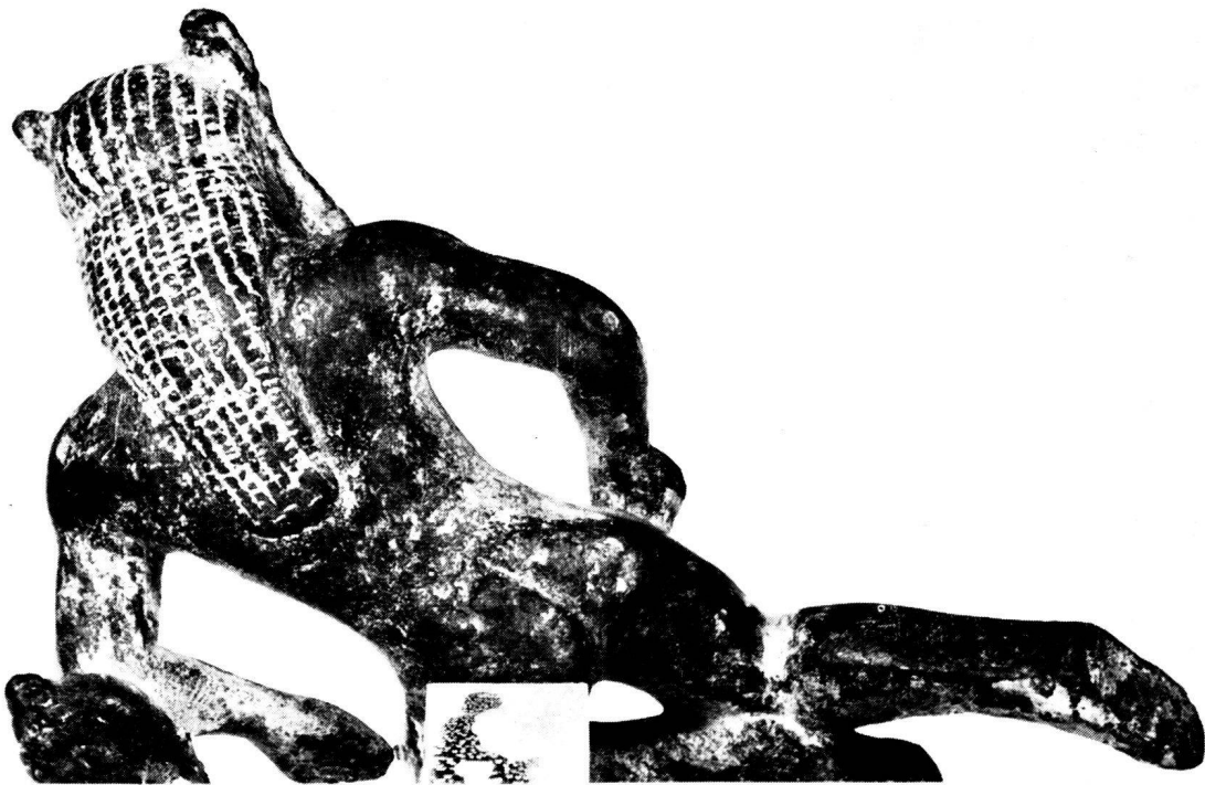
2. Bronzesilen aus Olympia. Rückansicht, L. 8,0 cm, H. 5,1 cm.