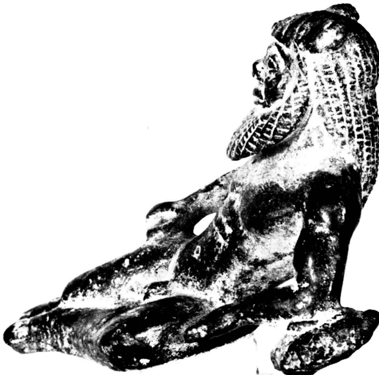
4. Bronzesilen aus Olympia, Schrägansicht.