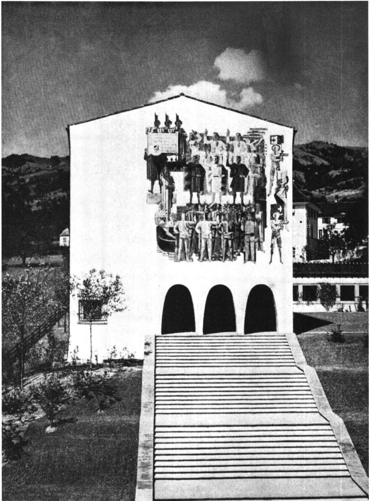
Das neue Bundesbriefarchiv in Schwyz mit dem Wandbild «Fundamentum» von Heinrich Danioth.