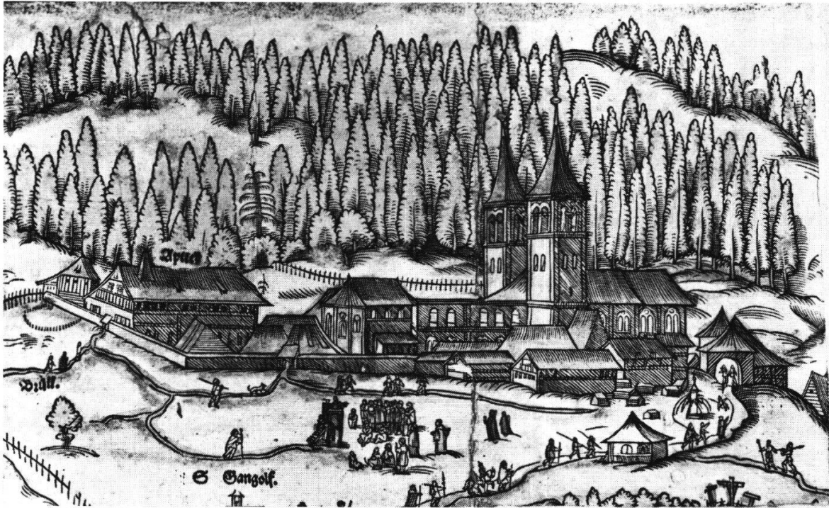
Der Ausschnitt aus der Sammlung Wickiana, Zürich, zeigt deutlich, dass das obere Münster nach dem Brand von 1577 noch nicht wiederhergestellt ist.