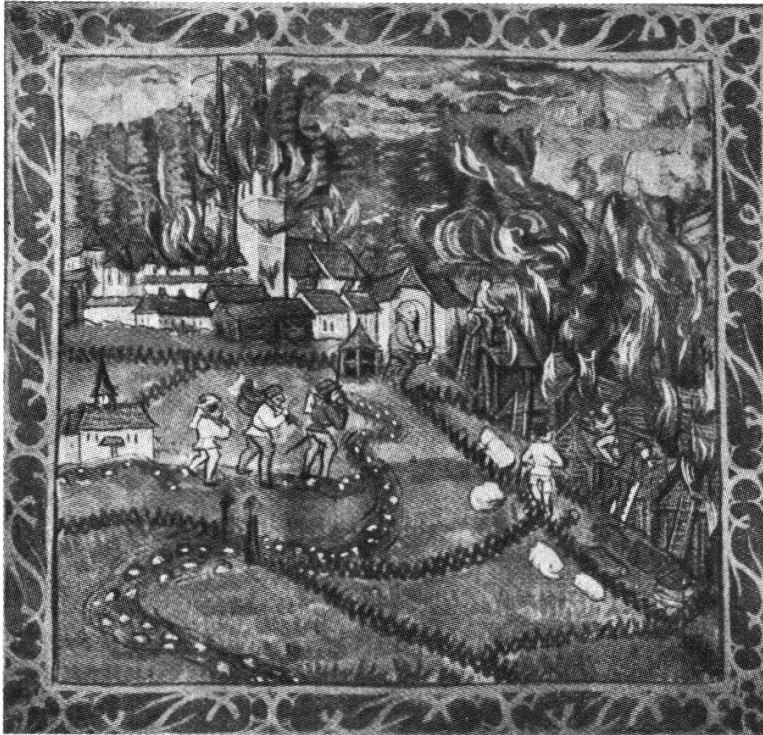
Der Luzerner Diebold Schilling zeigt in seiner Schweizer Bilderchronik den Brand von Kloster und Dorf Einsiedeln im Jahre 1509.

in seiner Geschichte den Verlust kaiserlicher und königlicher Urkunden und Diplome, wie auch, «daß dennoch viel weltlicher Hausrat zu Grunde gegangen».