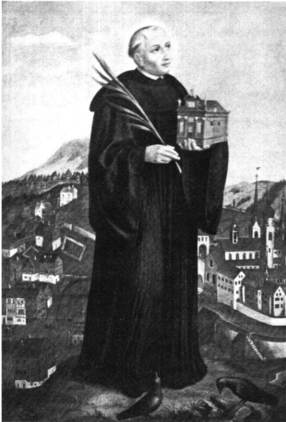
Einsiedeln um die Mitte des 17. Jahrhunderts, also wenige Jahrzehnte vor dem Dorfbrand 1680. Gemälde im Stift Einsiedeln mit dem hl. Meinrad.

gewessen und war und ihnen kein Raht. Ich kann schier vor Zäher und Mattigkeit die Feder nit führen, solches zu beschreiben: Fasse doch im Namen Gottes das Hertz, und will thun, was ich kan, allein unßern Nachkömmling zur Warnung, sich Tugendlich zu verhalten ouch menschlicher Weiß nach Möglichkeit solchem Ellend vorzubringen: Versichere aber den lieben Lesser, das nit den sechsten Theil erzehlen oder schreiben kan, wie es hergangen, sonder will die Schatten disses Ellendts dir vorbilden.