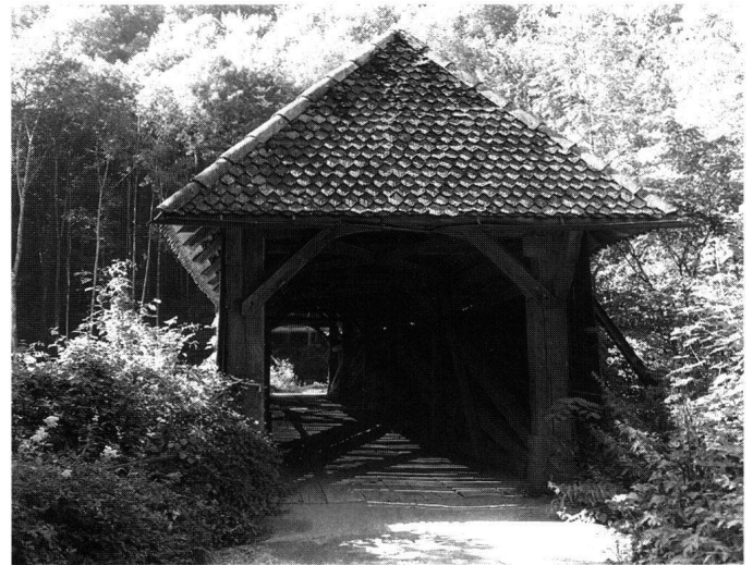
Abb. 3: Die neue Brücke von 1810, die im Laufe des 19. Jahrhunderts noch oft als «steinig Brügg», zunehmend aber als «Suworow-Brücke» bezeichnet wurde. Aufnahmen durch das Staatsarchiv Schwyz im Juli 1995.

mehrfaches Hänge-Sprengwerk . . . Das massive Hänge- werk ist ein fünfseitiger Stabpolygon mit vier Paar Hänge- pfosten. Die Streben vom Obergurt (Stabpolygon) sind vierfach und im Mittelfeld (Brustriegel) dreifach geführt, mit einer zusätzlichen Kreuzversteifung. Zwei übereinan- der verdübelte Längsbalken dienen als Streckbalken. Das zweifache Trapezsprengwerk – Streben, die den ersten und zweiten Hängepfosten gegen das Widerlager abstützen – dienen als zusätzliche Verstärkung des Tragwerks. Beides zusammen bildet das damals oft angewandte Hänge- Sprengwerk.