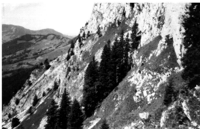
Abb. 4 & 5: Das Ruchband mit Adlerspitzli und Geissstock, aufgenommen im Aufstieg vom Holzflüeli (links). Blick auf das Ruchband in nord-westlicher Richtung (oben).