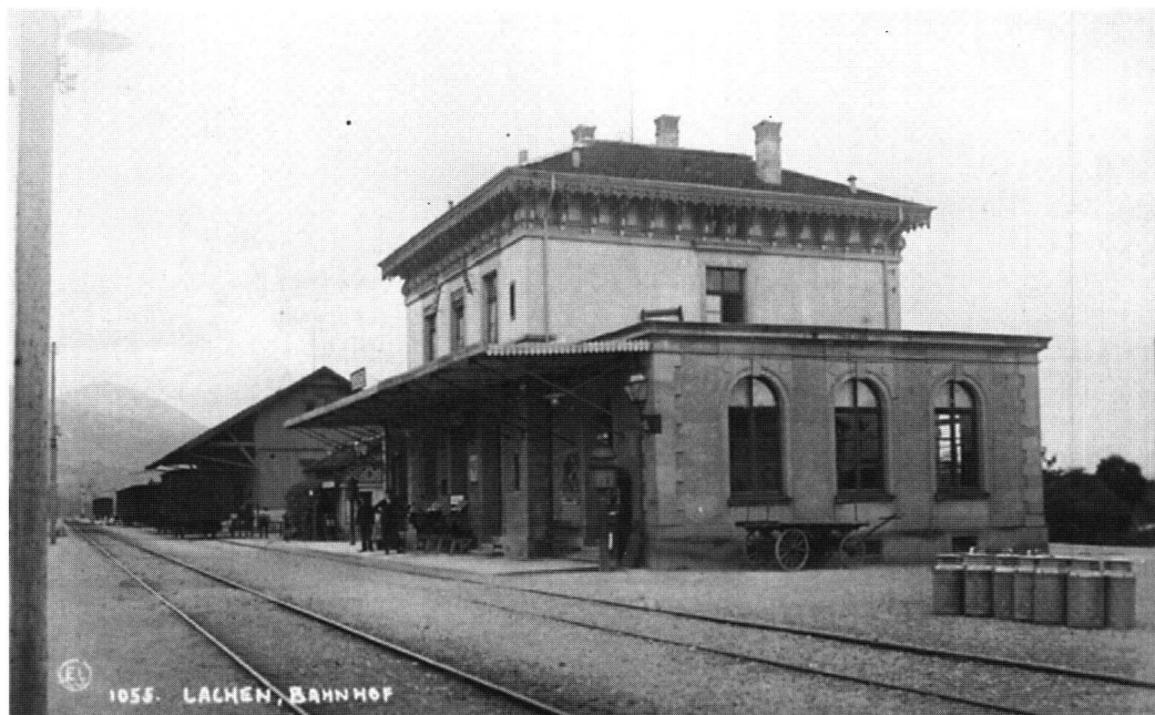
Abb. 1: Der Bahnhof von Lachen, 1875 erbaut, in einer Aufnahme um 1900.

Die Streckenführung und der Stationsbau der Nord-Ost-Bahn-Gesellschaft erregten aber auch die Gemüter. Vom neuen Verkehrsmittel wollten möglichst alle Dörfer profitieren. Diesem Wunsch konnte nicht entsprochen werden. Bekannt ist der unerfüllte Wunsch von Tuggen und Schübelbach, eine eigene Station zu erhalten. 22 Die Lokalpresse vom 9. Oktober 1875 berichtet von Anschlügen und Sabotageakten auf die Schienen in der Obermarch. Das Bezirksamt ermittelte gegen einen Peter Bruhin, genannt «Holländer», welcher aus Verärgerung über den nicht gewährten Bahnhof Schübelbach die Schienen gelöst hatte. Auch der Schreiber der Drohbriefe an die Direktion der Nordostbahn konnte zur Rechenschaft gezogen werden. Franz Xaver Benz im Schorrenhof zu Tuggen verfolgte mit seinen Drohschreiben das gleich Ziel wie Bruhin. 23