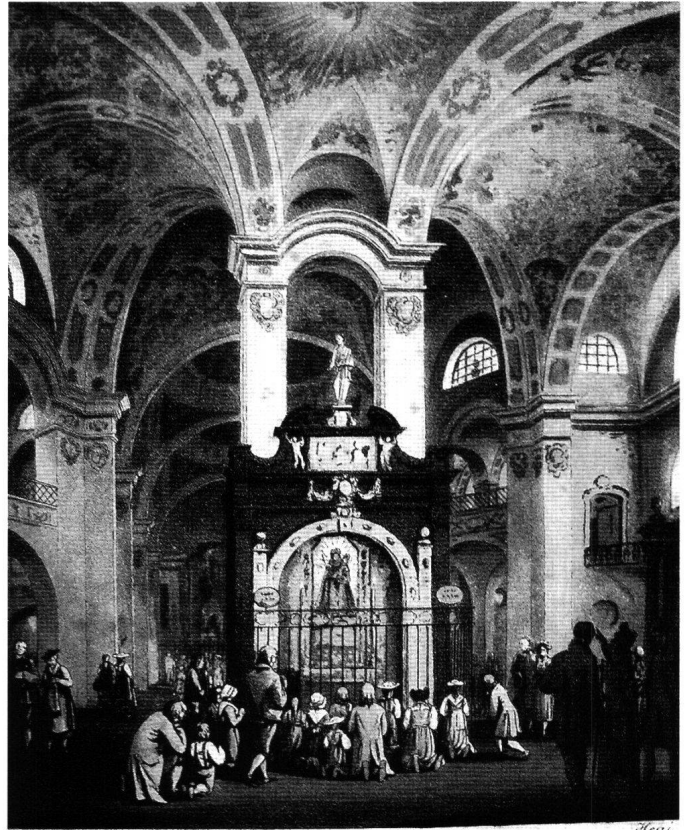
Das Innere der Kirche zu Maria Einsiedeln. L'intérieur de l'Eglise de Notre Dame des Hermites.

Ihre Fortsetzung erhielt die Festfeier am darauf folgenden Sonntag, dem Rosenkranz-Sonntag. Auf Anordnung der Herren von Schwyz fanden sich «aus jedem Bezirk des Kantons der erste Vorsteher ... zu besonderer Erbauung der unzähligen Volksmenge» ein. «Um 4 Uhr morgens wurde in der einst weilen auf vormaligem Plaze errichteten Kapelle mit deren Beleuchtung ein feyerliches Amt gesungen. Vor- und Nachmittag waren Predigten, die das Volk von dem Äusserlichen dieses Gepräges auf den wahren Geist und Zweck derselben hinwiesen. Nach 7 Uhr Abends war noch eine sehr feyerliche Prozession, wobey nicht nur die Fronte des Stiftes und des Dorfes, sondern auch von innen die ganze Kirche und Kapelle Tagheiter beleuchtet waren; nach welcher endlich der Musik-Chor durch das «Herr Gott, dich loben wir!» die ganze Feyerlichkeit einen erfreulichen Beschluss gab.» 156