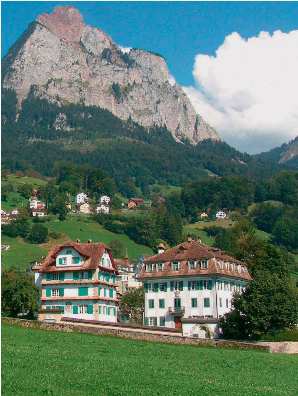
Das Steinstöckli war ab 1745 Hedlingers Sitz in Schwyz.