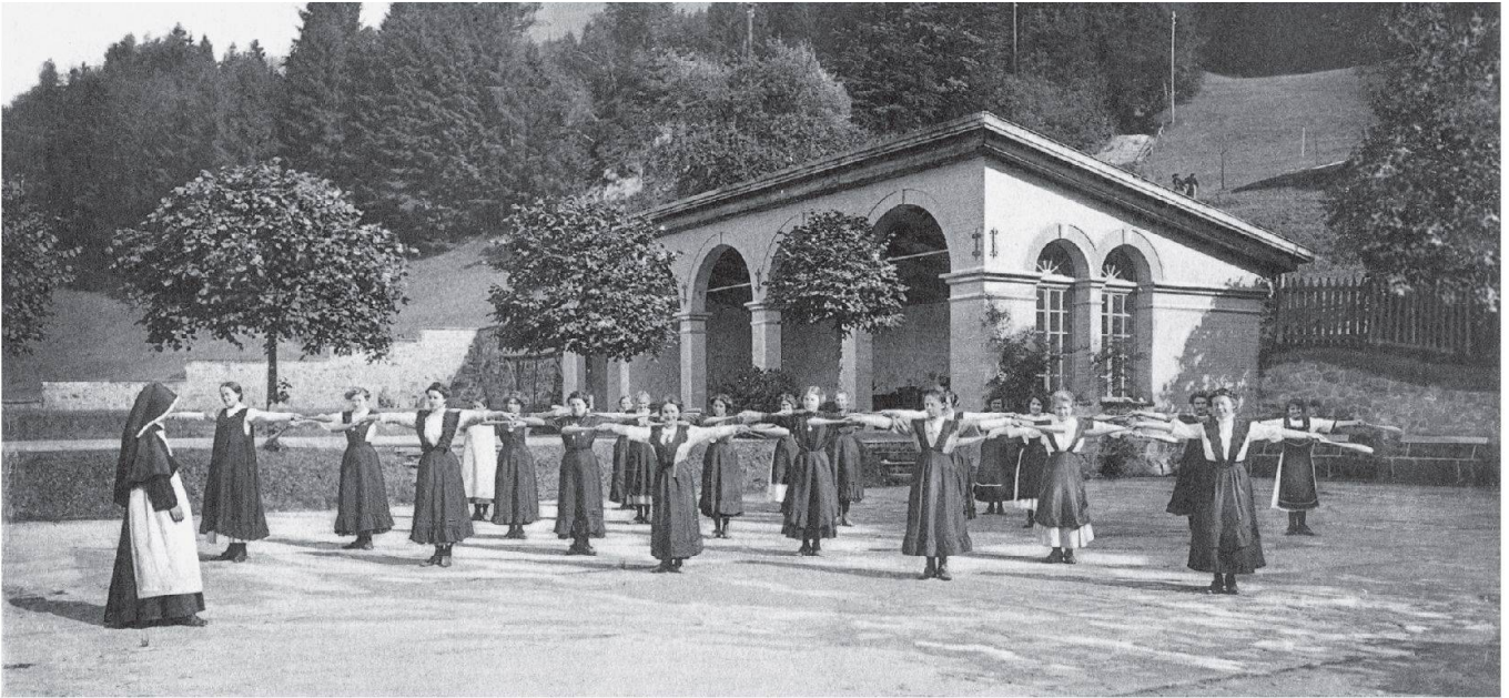
Turnunterricht im Theresianum Ingenbohl in der Frühzeit der Lehrerinnenausbildung.

oder in Gefängnissen ausgeübt. Die 1894 vom Papst offiziell anerkannte Kongregation gründete auch Missionen. Die erste Mission führte nach Indien (1894), es folgte eine Mission in China (1927–1945) und in Brasilien (1966). Auch während der beiden Weltkriege waren die Schwestern karitativ tätig. Sie richteten Lazarette ein, wo sie die verwundeten Soldaten beider Seiten pflegten. Es waren fünf Krankenstationen in der Schweiz, 122 in Böhmen, Ober- und Niederösterreich, Slawonien, Steiermark, Mähren, Baden, Tirol und Ungarn.