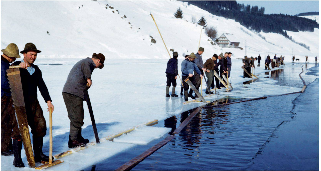
Eissagen auf dem grossen Weiher im Unterdorf um 1958.

Als während des Ersten und Zweiten Weltkrieges der Steinkohleimport erschwert und teuer war, waren die «Turbenmöckli» (Briketts) heiss begehrt. Das Brennmaterial wurde unter anderem für Lokomotiven, für mit Dampf angetriebene Autos und das Gewerbe verwendet. All die Jahre wurde auch «Turpägüsel» gewonnen. Der lose getrocknete Torf wurde im Wohnhausbau zu Isolationszwecken, im Gartenbau und zum Anstreuen im Stall gebraucht.