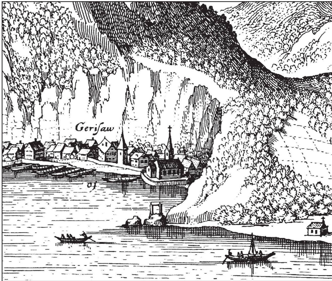
Gersau – Gerisaw: Ausschnitt aus der Ansicht von Matthäus Merian in seiner «Topografia Helvetiae» mit Dorf, Galgen am See und Kindlimord-Kapelle.

zum Oberholz bis östlich der Chindli-Kapelle, nach Westen durch den Gersauerstock und die steilen Flanken von Ober- und Usser-Urmi bis hinunter zur Ober Nas. Diese abgelegene, klimatisch geschützte Moränenlandschaft wurde aber häufig und immer wiederkehrend von gewaltigen Unwettern heimgesucht. Der äussere (Sagenbach) und der innere Dorfbach überfluteten im Rhythmus einer Generation bis in unsere Zeit Fluren und Felder, Strassen und Wege und richteten im Dorf jeweils gewaltigen Schaden an. Verschont blieb die in der Kirchmatt am Fuss der «Chilenfluo» gelegene Marzellus-Kirche. Die isolierte Lage – die Strasse von Gersau nach Brunnen wurde erst 1867, jene nach Vitznau 1886 erstellt – und die besondere Eigenart der geschichtlichen Entwicklung beeindruckten im 18. und 19. Jahrhundert Reiseschriftsteller und Gäste aus aller Welt. Eine junge Engländerin, Miss Helen Maria Williams, weilte 1794 in Gersau und schrieb ins Tage-