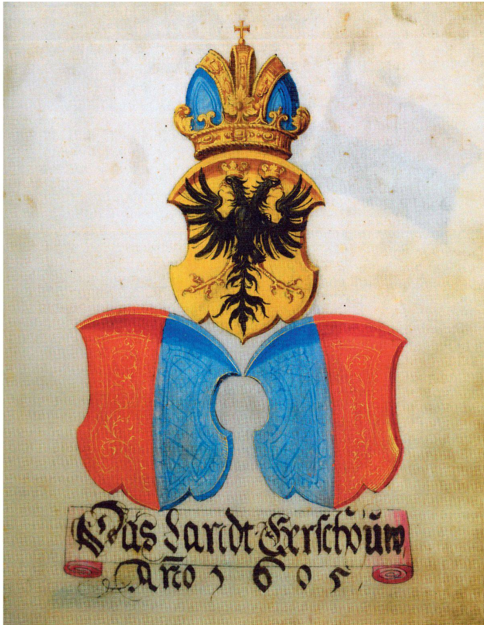
Das Gersauer Landeswappen, abgebildet im kleinen Landbuch von 1605.