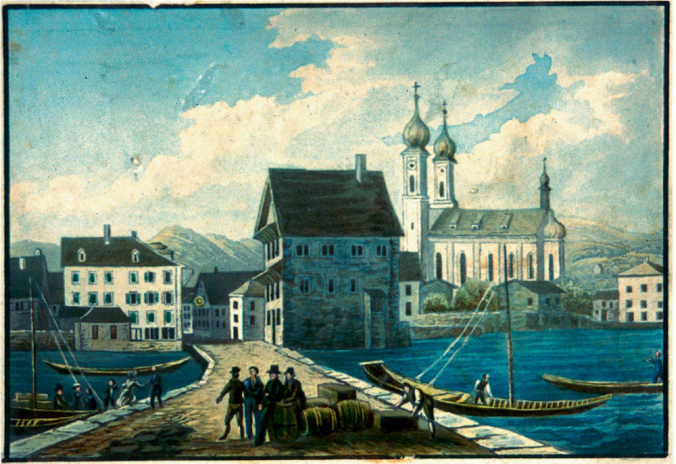
Ansicht des Lachner Hafens mit Gasthof zum Ochsen, Sust und Pfarrkirche um 1835. Während Jahrhunderten war die «Schifflande» Umschlagplatz von Gütern vom Landweg auf die Transportschiffe. Aufgrund des lokalen Verkaufmarkts wurde Lachen als «Marktflecken» bezeichnet.