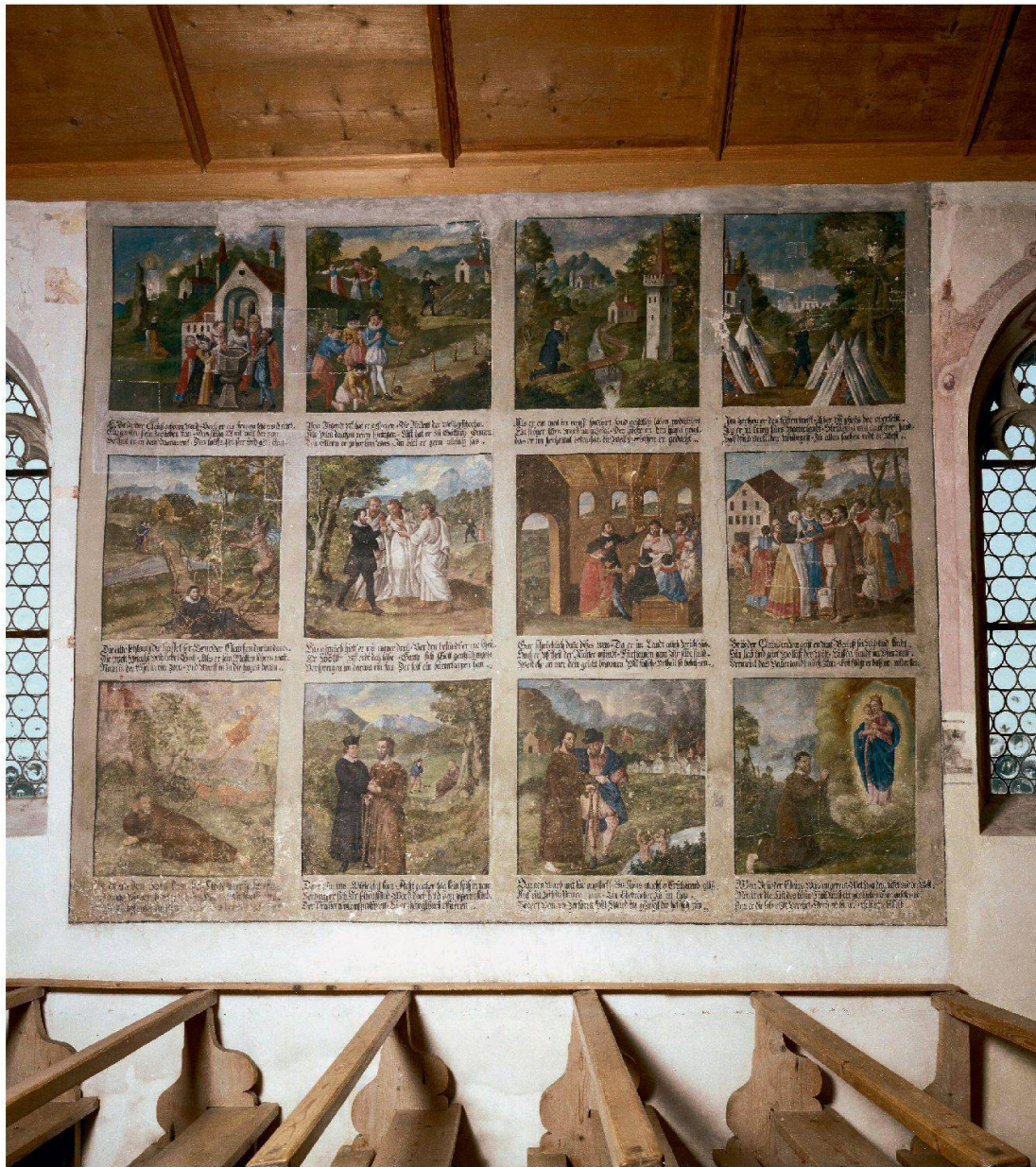
Der Bruderklausenzyklus aus dem Jahr 1623 in der Kapelle St. Jost bei Galgenen folgt in seiner epischen Breite und den beigefügten erklärenden Tituli noch mittelalterlicher Bildauffassung.