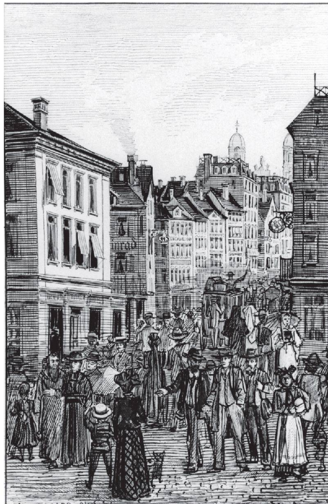
Städtisches Treiben auf der Einsiedler Hauptstrasse mit den aufgestockten und modernisierten Gasthäusern und Hotels. Tuschzeichnung von Laurenz Landenberger aus dem Jahr 1891.

Die Gebrüder Benziger und Josef Anton Eberle waren anfangs als Bezirksräte, später durch ihre weitere politische