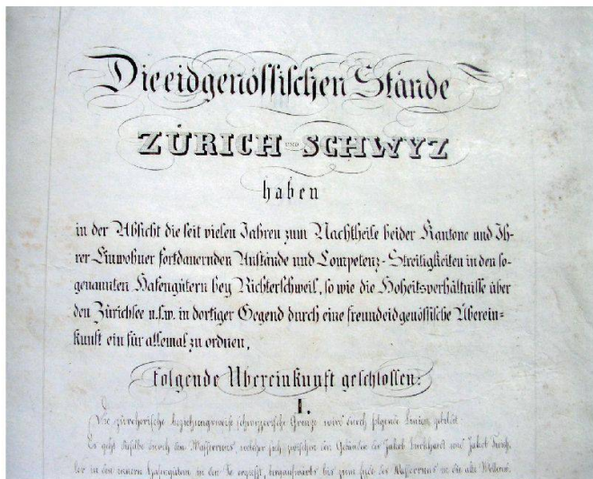
Der Vertrag von 1841: Erste und letzte Seite.