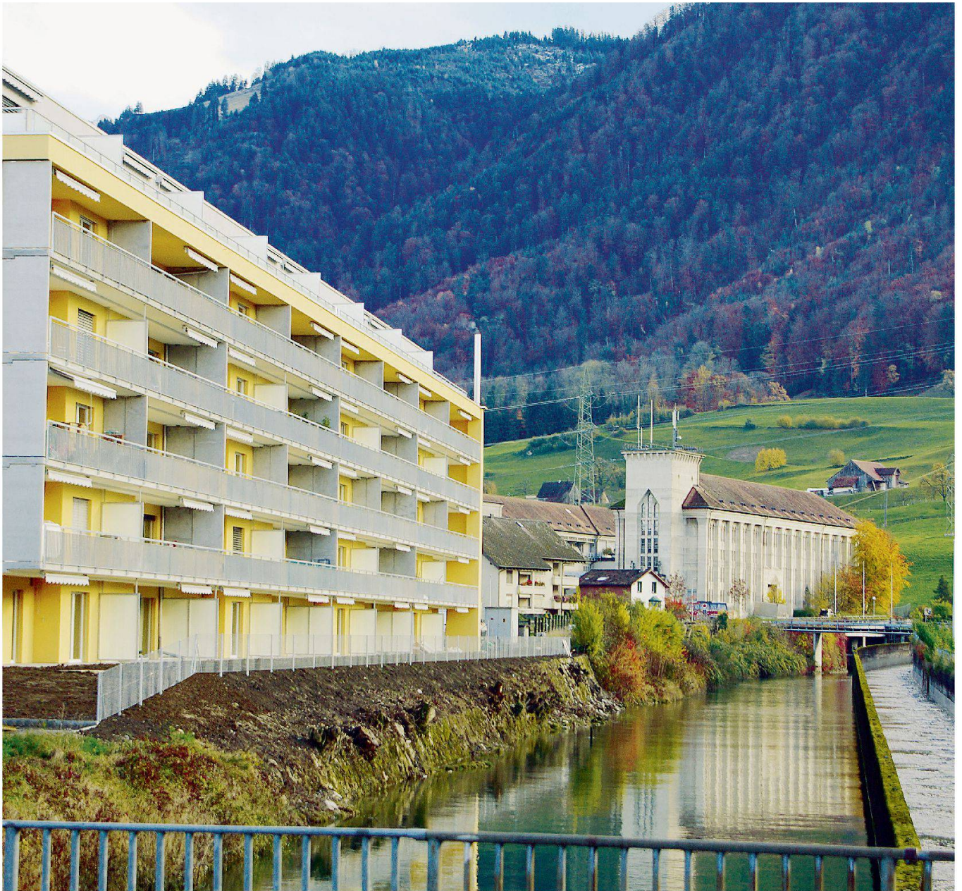
«Kathedralen des Fortschritts», einst und jetzt: vorne die Wohnüberbauung in der Dorfmitte, hinten die Zentrale des Kraftwerks Wägital in Siebnen.