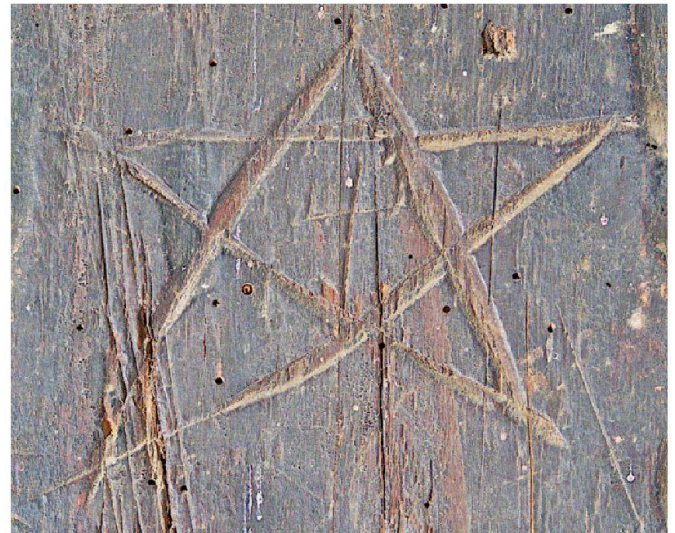
Abb. 1: Pentagramm mit zentral eingeschriebenem Kreuz (H: 7.8 cm, B: 9.1 cm); Mantelstud Ost, Raum 1.7, Kreuzgasse 3, Steinen.

Die Datierung der Graffiti erweist sich als schwierig, da in Kombination mit der Baugeschichte meist nur materielle Details Hinweise auf ihr Alter geben können. Das Pentagramm am Mantelstud, das die gleiche Patina aufweist wie die Umgebung, dürfte bald nach dem Bau des Hauses (laut Dendrodaten 1472/73) angebracht worden sein (Abb. 1). Die Ritzlinien im Obergeschoss, die helle Splitter aufweisen, entstanden wohl kurz vor dem Anbringen von Jute und Tapete im 19. Jahrhundert (Abb. 3).