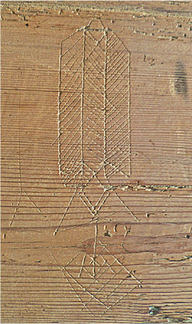
Abb. 2: «Panneel» (H: 17.2 cm, B: 5 cm); westliche Nordwand, Raum 2.2, Kreuzgasse 3, Steinen.