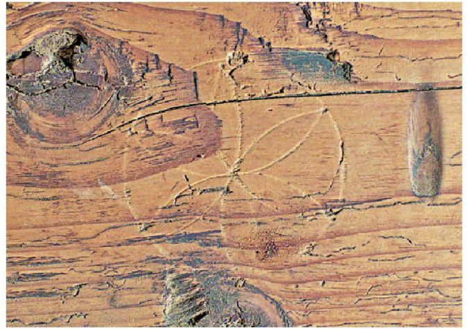
Abb. 3: Zirkelrosette (D: ca. 8 cm); westliche Nordwand, Raum 2.3, Kreuzgasse 3, Steinen.