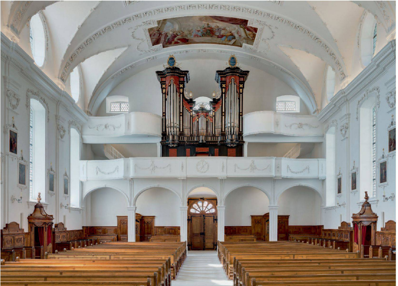
Abb. 14: Gersau, Pfarrkirche St. Marzellus. Die imposante Orgel rahmt das grosse Westfenster.

In der zweiten Hälfte des 18. Jahrhunderts entwickelten sich Architektur- und Dekorationsformen, die sich wiederum von den üppigen Rokokoformen zu unterscheiden begannen. Es kamen erneut Lorbeerblätter, Rosetten und Blattranken in Mode, die formal ähnlich schon die Raumausstattungen der Spätrenaissance und des Frühbarock geprägt hatten. Auch die Architektursprache wurde wiederum schlichter und additiver. Die Kirche Gersau steht eben an einem solchen Wendepunkt. Zwar entstand sie erst nach der französischen Revolution, die die üppigen quirligen Rokokoformen endgültig hinweg gefegt hatte. Es dominierte in diesen Jahrzehnten bei uns jedoch immer noch der Einfluss der süddeutschen Handwerks-Tradition. Gersau baute seine neue Kirche in einer politisch schwierigen Zeit.