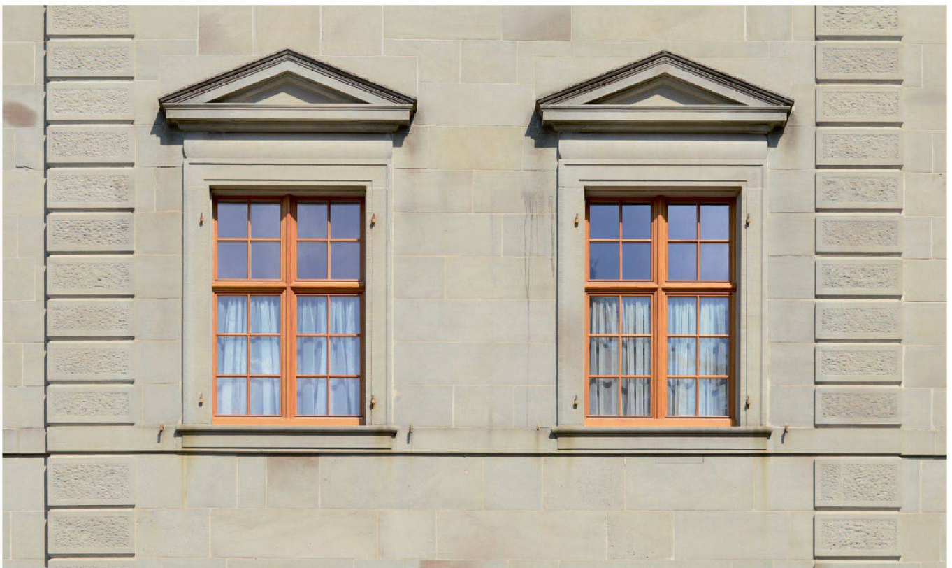
Abb. 24: Einsiedeln, Kloster, Fenster Klosterfront. Die durch das Unwetter zerstörten Fenster wurden durch neue, nach altem Vorbild gestaltete, ersetzt. Die eichenholzfarbige Behandlung konnte durch den Untersuch an einem Fenster des 18. Jahrhunderts nachgewiesen werden.

Auf der Südseite des Klosters (Abteihof) sind noch etliche alte Fenster erhalten. Ein Kellerfenster war ein vollständig originales und diente dem Untersuch der Schichtabfolge und der angewandten Materialien. Dabei zeigte sich, dass das Fenster vier Mal übermalt worden war. Unter dem weissen und drei grauen Farbanstrichen fanden sich zwei lasierende Anstriche in gelb-ockerfarbiger Abtönung. Das Holz war Föhrenholz. Mit dieser Färbung wurden die Fenster dem Farbton der Eichentüren der Kirche angeglichen. Eine Fotomontage, die diesen Zustand mit den ockerfarbigen Fenstern wiedergab, bestätigte, dass dadurch Seitenflügel und Kirchenfassade wieder zu einer Einheit zusammenwachsen und nicht mehr additiv wirken. Der Vorschlag wurde in der Klostersgemeinschaft diskutiert und die Ausführung beschlossen. Mit den neu eingesetzten lasierten Fenstern und dem Verzicht auf die Fensterläden wirkt die Klosterfassade heute wesentlich klarer und die Steinstruktur wird betont.