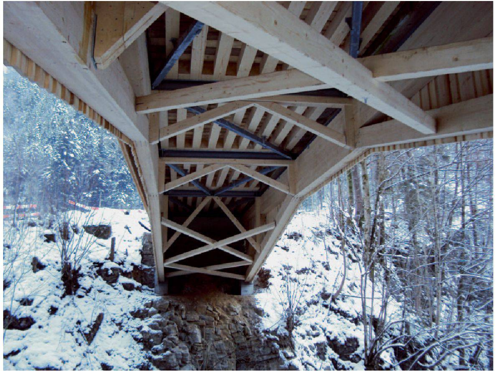
Abb. 7: Schwyz, Suworowbrücke. Blick in die Unterkonstruktion der Brücke, die mehrheitlich ersetzt werden musste.

auch vor Feuchtigkeit und damit vor erneuter Fäulnis schützen. Zusammen mit den statisch bedingten Instandstellungsmaßnahmen wurden im Rahmen der Sanierung der Holzfahrbahnbelag, die seitliche Holzverschalung sowie die Biberschwanz-Dacheindeckung ersetzt. Dabei wurden gleiche Materialien eingesetzt wie bei der alten Brücke.