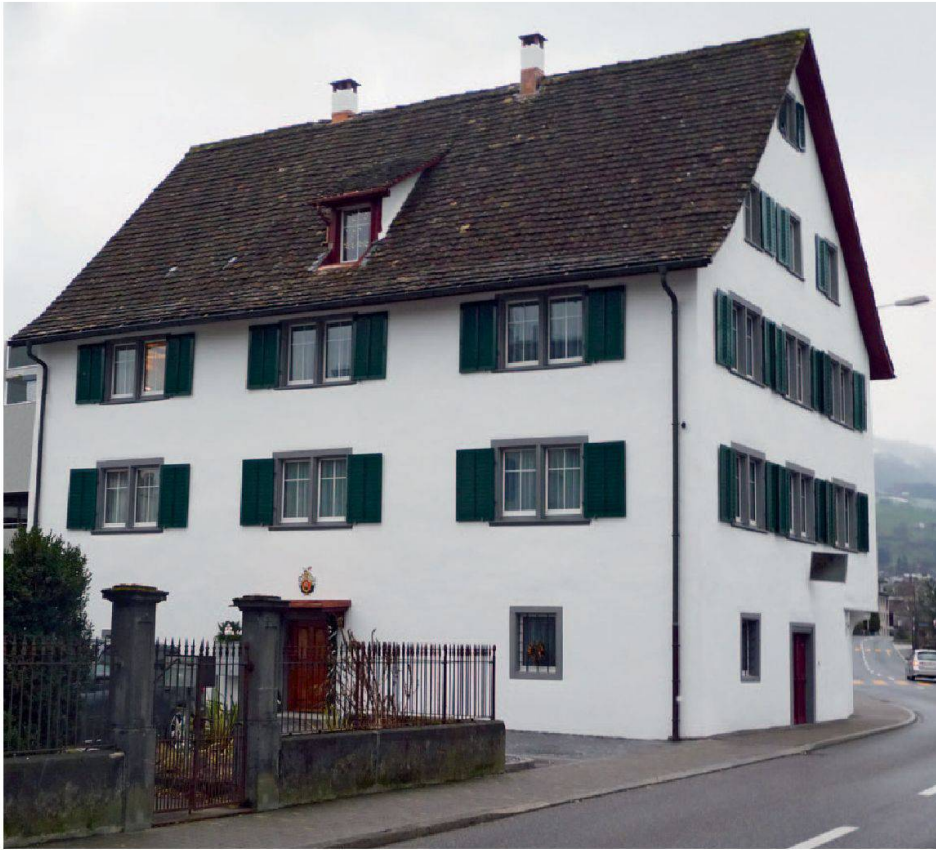
Abb. 16: Lachen, Zürcherstrasse 17. Das schlicht instrumentierte Wohnhaus besticht durch seine ausgewogenen Proportionen.

Fensteranordnung ist noch unregelmässig. Die verputzten Fassaden des Hauses, das direkt an der stark befahrenen Zürcherstrasse steht, hatten seit der letzten Aussenrestaurierung 1976/77 sehr stark gelitten. Aufsteigende Feuchtigkeit hatte dem Verputz zusätzlich zugesetzt, sodass das Anlegen eines aufwändigen Sickergrabens notwendig geworden war, um die Feuchtigkeit abzuleiten. Der versalzene Verputz insbesondere im Sockelbereich musste grossflächig entfernt und ersetzt werden. Die Sandsteineinfassungen der Kellerfenster und der Portale konnten teilweise gefestigt und ergänzt werden. Bei einigen Fensterbänken kam jedoch jede Hilfe zu spät, sodass vollständiger Ersatz vorgenommen werden musste. Das Fachwerk und die Dachuntersichten wurden neu mit Ölfarbe in Ochsenblut-Rot bemalt. Der Verputz erhielt einen atmungsaktiven Mineralfarbenanstrich. Neu gefasst wurde auch das Schornowappen über dem Hauptportal. Es ist zu hoffen, dass mit der Realisierung der geplanten Umfahrungsstrasse das Haus, das stark in den Strassenraum vorkragt, besser geschützt bleiben wird.