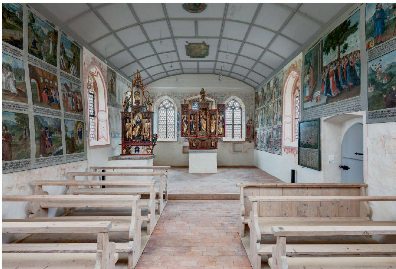
Abb. 17: Galgenen, Kapelle St. Jost. Das Innere der Kapelle wirkt trotz der Ausstattung aus verschiedenen Epochen harmonisch.

Die Restaurierungsgeschichte wird im Rahmen der Restaurierungsdokumentationen zu Händen der Denkmalpflege und der Pfarrei Galgenen gründlich aufgearbeitet werden, sodass sich der Bericht auf die nun durchgeführten Massnahmen beschränken kann. Auslöser für eine