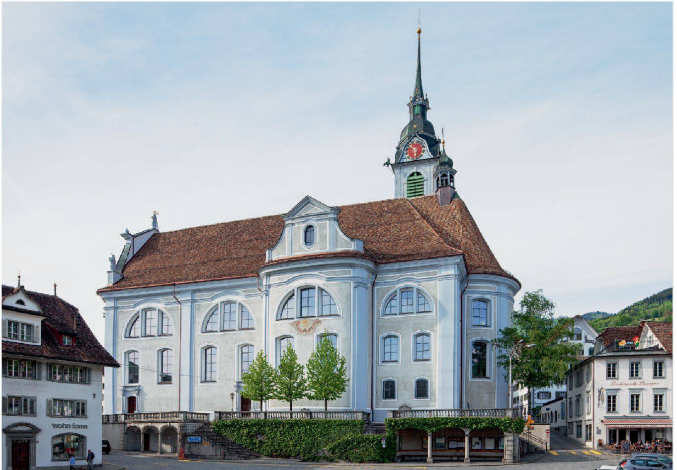
Abb. 1: Schwyz, Pfarrkirche St. Martin. Durch den differenzierten Putzauftrag hat sich die plastische Wirkung der Fassaden wesentlich verbessert.

flächen wurden rund um die Fenster und längs der Lisenen von hellen Bändern und dunklen Linien begleitet. Dies gab den grossen Fassaden eine gewisse Struktur, ohne dass jedoch etwelche Differenzierungen der Oberflächen vorhanden waren. Zudem waren bei den aus sogenanntem Seewener-Kalk gemauerten Lisenen und beim aus massiven Steinblöcken bestehenden Glockengeschoss des Turmes die Fugen künstlich stark betont worden. Aus demselben Material bestehen auch der Sockel und ein Teil des Hauptportals,