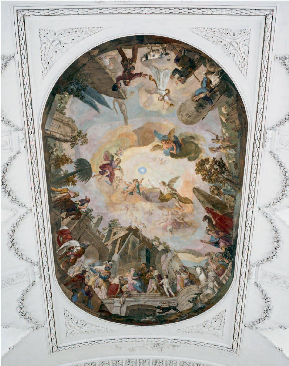
Abb. 15: Gersau, Pfarrkirche St. Marcellus. Trotz der späten Entstehungszeit ist das grosse Deckenbild von Josef Anton Messmer (1747–1827) noch vollständig der barocken Tradition verpflichtet.

Kanton Schwyz. So orientiert sich die Eingangsfront an derjenigen der Pfarrkirche Schwyz. Über dem zentralen angeordneten Eingang steht wie in Schwyz ein hohes rundbogiges Fenster. Auch das angedeutete Querschiff zwischen Kirchenschiff und Chor scheint sein Vorbild in Schwyz gefunden zu haben.