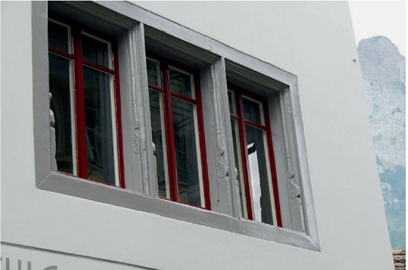
Abb. 9: Schwyz, Reichsstrasse 5. Die geschnitzten gotisierenden Fenstergewände sind in Schwyz typisch für das 17. Jahrhundert.

feinkörnigen Verputz überzogen und hell bemalt. Ein Befund war keiner auszumachen, da sich vom alten Verputz keine Restflächen fanden.