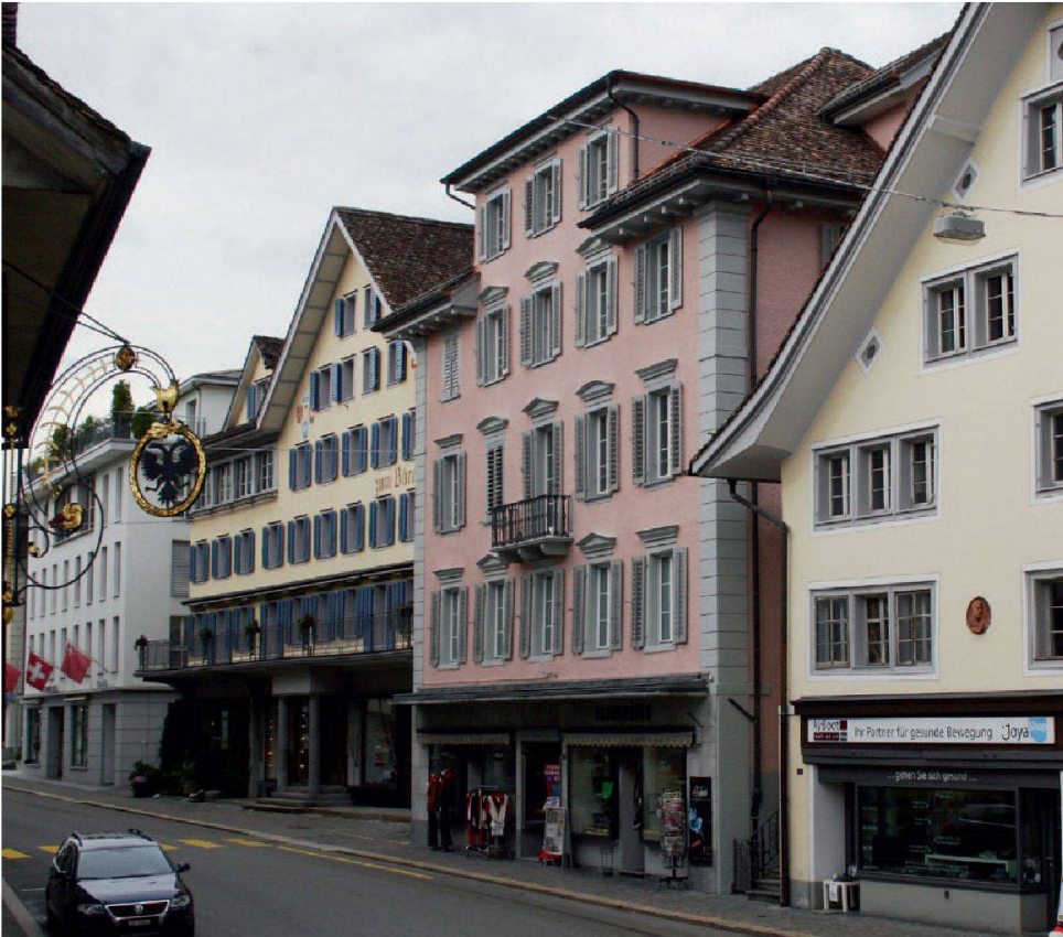
Abb. 8: Schwyz, Herrengasse 8, Triner. Der gut proportionierte Biedermeierbau setzt einen starken Akzent in der nördlichen Häuserzeile an der Herrengasse.

typischer klassizistischer Baukörper mit regelmässiger Fensereinteilung, zentralem Balkon mit Gusseisengitter und knapp formuliertem Walmdach, das gegen das Strassenbild hin wenig in Erscheinung tritt. Die Wiederherstellung der originalen Farbigkeit nach Befund in zartem Lachsrosa und Sandsteingrau unterstreicht den Charakter des Biedermeierhauses und bindet das Gebäude hervorragend in die Häuserzeile an der Herrengasse ein.