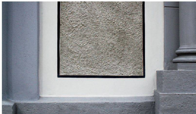
Abb. 2: Schwyz, Pfarrkirche St. Martin. Detailaufnahme der verputzten Fassade. Die Flächen mit grobem Besenwurf werden von geglätteten Bändern begleitet.