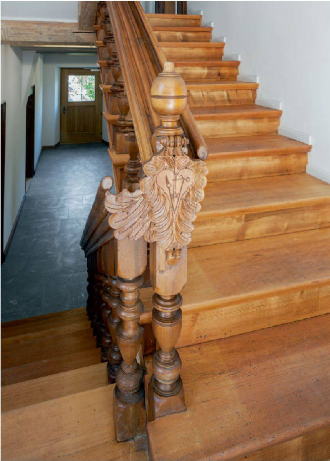
Abb. 12: Ingenbohl Pfarrhaus, Klosterstrasse 6. Das an den Treppenfosten montierte Schild zeigt den Schwamm sowie die Lanze als Leidenswerkzeuge Christi.

ausgebildet ist die Decke der südlichen Stube im ersten Obergeschoss. Dort sind zusätzlich zu den gliedernden Stäben geschnitzte hängende Zapfen in die Füllungen montiert. Leider wurde diese Decke vor wenigen Jahren unsachgemäss mit einem Sandstrahlgerät behandelt und damit teilzerstört. Zwei Büffets des 18. Jahrhunderts stehen in den beiden Stuben des Wohngeschosses. Die Wandtäfer waren mehrheitlich im 19. Jahrhundert ersetzt worden. Im zweiten Obergeschoss existiert eine Raumausstattung mit Stuckdecke und Parkettboden, die in der ersten Hälfte des 19. Jahrhunderts entstanden ist. Ziel der Restaurierung war es, diese erhaltene Substanz, meist aus Holz, sorgfältig zu restaurieren und zu ergänzen. Die Korridore und Treppenhäuswände wurden glatt verputzt und hell gestrichen. Der