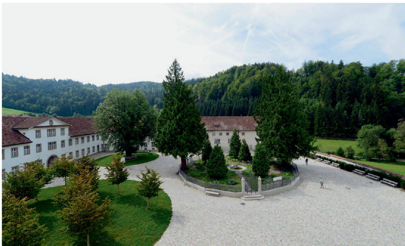
Abb. 22: Einsiedeln, Kloster, Abteihof. Blick in den Hof von Norden. Die alte Substanz wird durch neue Elemente wie das Baumrondell ergänzt.

Forderungen nach der Realisierung eines Unterstandes für Pilgergruppen wurden bald fallengelassen und der Platz