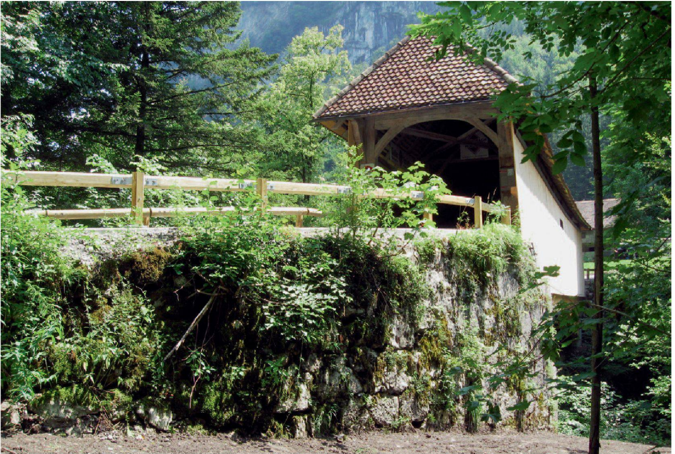
Abb. 6: Schwyz, Suworowbrücke. Die nach 1800 entstandene Holzbrücke ersetzte die bei den Franzoseneinfällen zerstörte Steinbrücke.

Brücke dient heute als Nebenzufahrt zu verschiedenen Liegenschaften und vor allem als Fussgänger- und Fahrradsteg auf dem historischen Suworow-Wanderweg von Schwyz nach Muotathal.