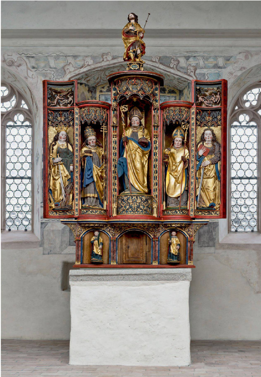
Abb. 18: Galgenen, Kapelle St. Jost. Der Hegner-Altar gehört zu den originellsten mittelalterlichen Kultobjekten im Kanton Schwyz.