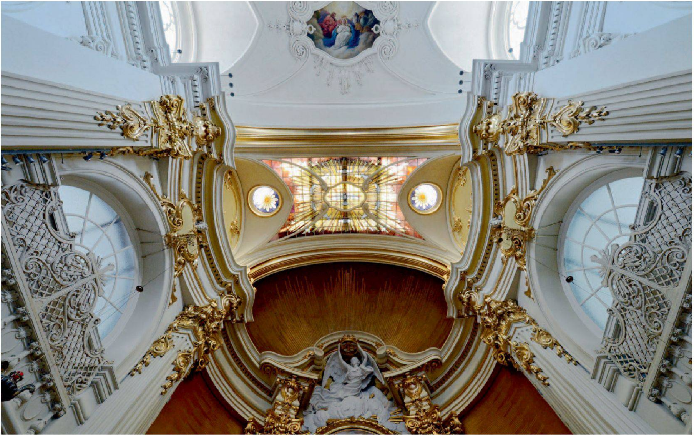
Abb. 5: Schyz, Kirche Kollegium Kantonsschule Schyz. Blick in das reich stuckierte Gewölbe des Chores mit der interessanten Verglasung, die indirektes Licht von oben in den Chor führt.

in Rom. Wegen der Lage zwischen den beiden Schulflügeln des Kollegiums beschränkt sich die Befensterung der Kirche auf die Westfassade sowie auf die Zone über dem kräftigen Kranzgesims, wo breite rundbogige Fenster den Raum belichten. Kräftig modellierte, jedoch weiss belassene Stuckaturen begleiten die Architektur. Einen starken Akzent setzen die von oben beleuchtete Buntverglasung über dem Chorraum sowie der goldene Hintergrund des Hochaltars.