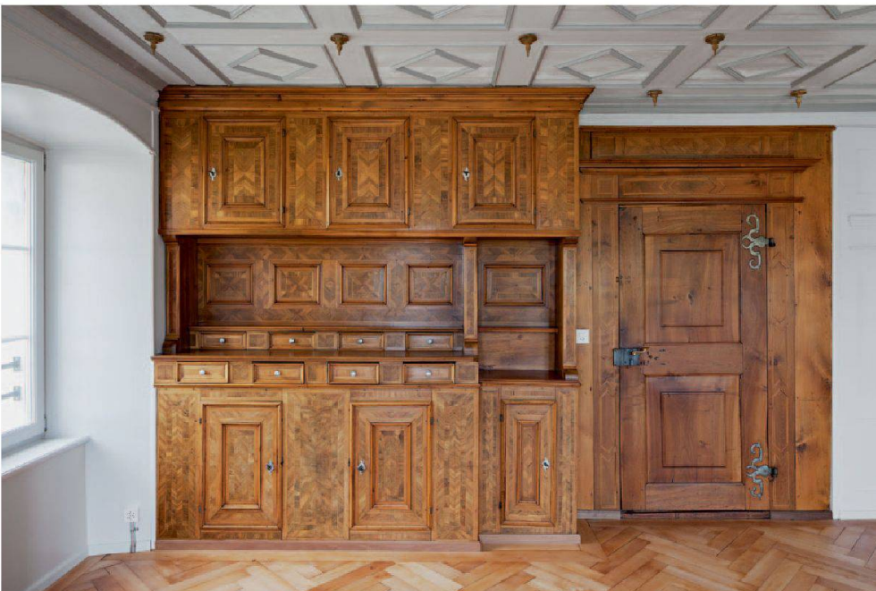
Abb. 11: Ingenbohl Pfarrhaus, Klosterstrasse 6. In der Stube mit Barockdecke steht ein reiches Büffet aus der Bauzeit. Erhalten ist auch das dazugehörige Türgericht.