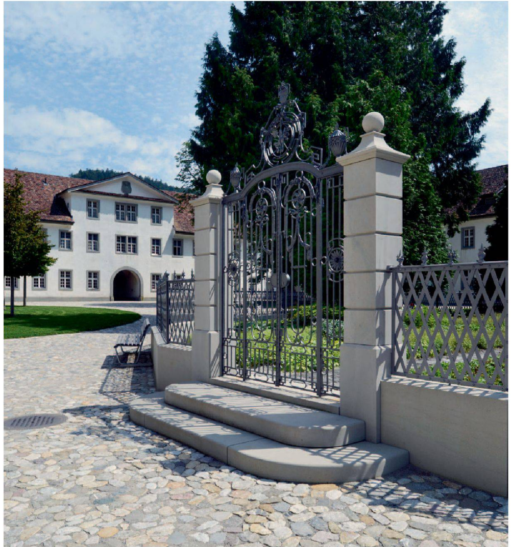
Abb. 23: Einsiedeln, Kloster, Abteihof. Zum alten Bestand gehört das Portal zum Rondell sowie die Metalleinfassung. Die Pflasterung besteht aus gespaltenen Bachkiesel.

im Wesentlichen unter Berücksichtigung des bestehenden Zustandes des 19. Jahrhunderts saniert. Die im Lauf der Jahre ohne langfristige Planungsperspektiven dazugekommene Bepflanzung in den westlichen Randzonen wurde eliminiert und damit der Zugang zum Klosterladen aufgewertet. Die Mauer vom Hoftor zur Alten Mühle wird neu von einer Hecke aus Eiben begleitet. Zudem wurde ein neues Rondell mit Schotterrassen und Baumbepflanzung als schattiger Aufenthaltsort in der Nordostecke geschaffen. Das Rondell mit den beiden grossen Lebensbäumen (Thuja), dem Tor aus dem späten 18. Jahrhundert, das hier wohl in Zweitverwendung steht, und dem historistischen Eisenzaun