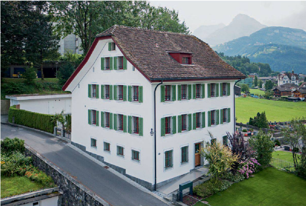
Abb. 10: Ingenbohl Pfarrhaus, Klosterstrasse 6. Der schlichte barocke Baukörper mit abgewalmtem Satteldach und regelmässig angeordneten Fenstern dominiert den Hügel neben der Pfarrkirche.