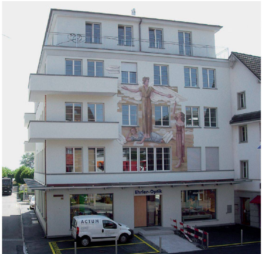
Abb. 25: Küsnacht, Bahnhofstrasse 17, Alte Post. Die streng gestalteten Fassaden orientieren sich an Ideen des Neuen Bauens. Die Allegorie der Post stammt vom Küsnachter Maler Werner Müller.