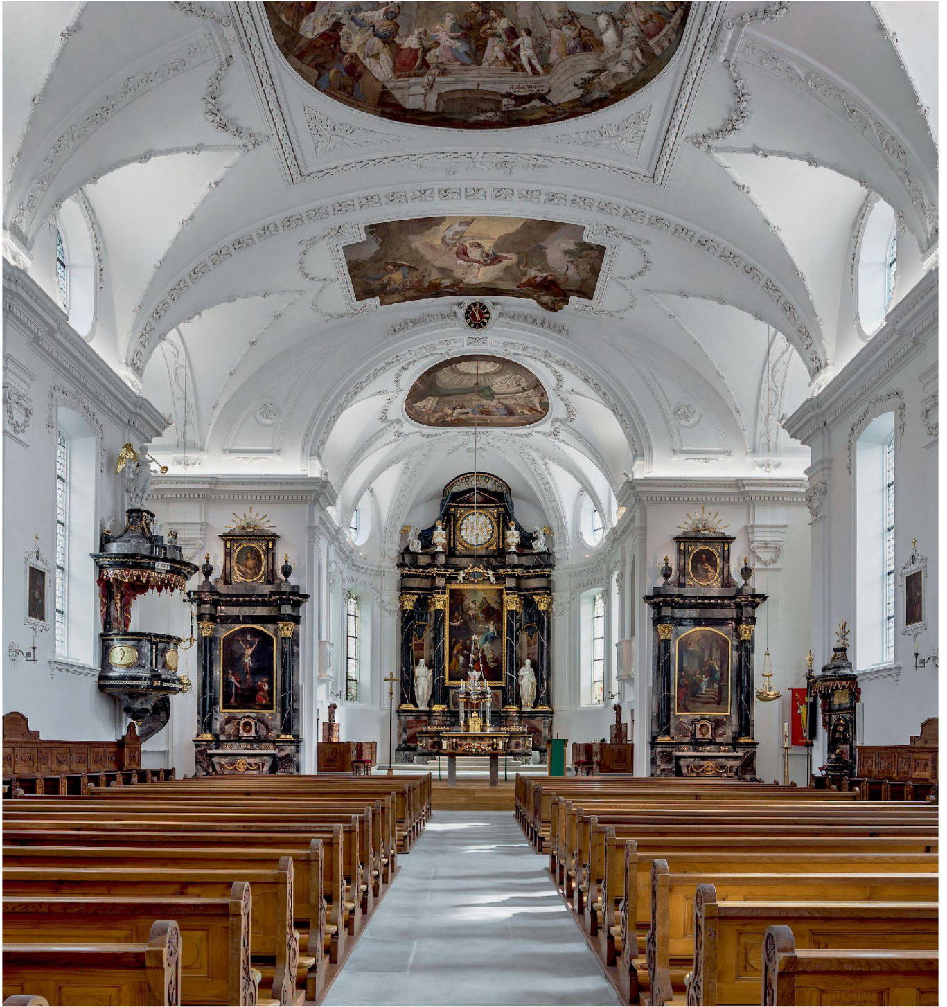
Abb. 13: Gersau, Pfarrkirche St. Marzellus. Blick vom breiten Kirchenschiff gegen den Chor.