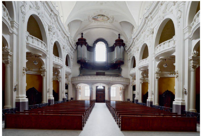
Abb. 4: Schwyz, Kirche Kollegium Kantonsschule Schwyz. Blick vom Chor gegen die Orgelempore. Die grosse Goll-Orgel rahmt das grosse Westfenster, das wesentlich zur Lichtführung im Raum beiträgt.