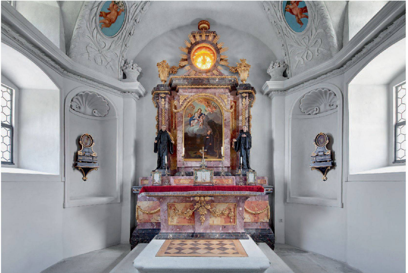
Abb. 21: Einsiedeln, Kapelle St. Meinrad, Etzel. Der klassizistische Altar aus Stuckmarmor umrahmt ein Fenster mit Goldgläsern. Die qualitätvollen Holzskulpturen auf dem Altar stammen vom Chorgestühl des Klosters Einsiedeln.

erbrachte keine Hinweise auf einen Vorgängerbau. 3 Mauern und Gelniveaus aus der Zeit vor 1697 fehlen. Entweder trug man vor dem Bau der Kapelle Erdreich ab – eine künstliche Geländekante ist östlich der Kapelle noch gut sichtbar – oder der Vorgängerbau stand an einem anderen Ort. Unter den Bauschichten der bestehenden Kapelle kam der in