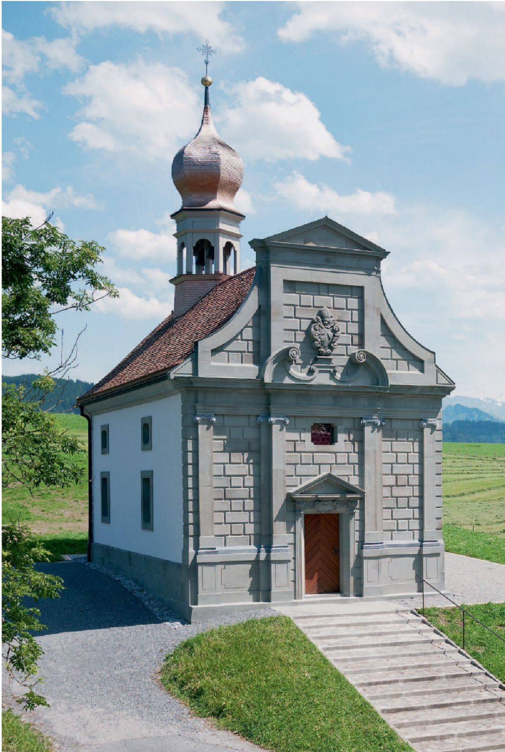
Abb. 19: Einsiedeln, Kapelle St. Meinrad, Etsel. Die Ausführung in Sandstein beschränkt sich auf die Haupt- und Südfassade. Die übrigen Fassaden sind lediglich verputzt.