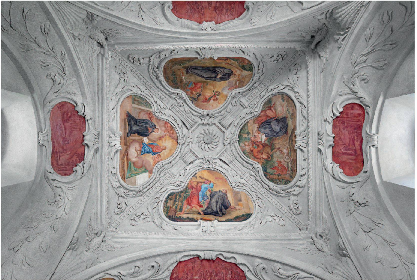
Abb. 20: Einsiedeln, Kapelle St. Meinrad, Etzel. Blick ins Gewölbe des Schiffs. Die kräftig modellierten Stuckaturen in steinfarbiger Fassung umrahmen die Deckenbilder.

Kapelle gerecht. Einen ursprünglichen Zustand des späten 17. Jahrhunderts anzustreben, war wegen den Brandschäden von 1758 nicht möglich.