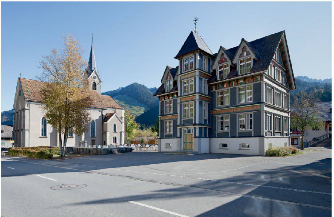
Abb. 2: Die neugotische Pfarrkirche St. Apollonia und das Schulhaus bilden innerhalb des Dorfkerns ein wichtiges, nach Plänen des Einsiedler Baumeisters Ignaz Hörbst (1829–1899) errichtetes Bauensemble des Historismus. Sie sind die bedeutendsten Baudenkmäler in Alpthal. Das 1892–93 erstellte Schulhaus gehört zu den eindrucklichsten Schulhausbauten im Kanton und wurde im Übergangsstil des späten Klassizismus zum Historismus errichtet. Die originellen Dekorationsmalereien und die architektonische Durchgestaltung sind der Nationalromantik beziehungsweise der aufkommenden Burgenromantik verpflichtet. Im feierlich wirkenden Innern der 1885–87 erbauten Kirche ist die originale Ausstattung integral erhalten.