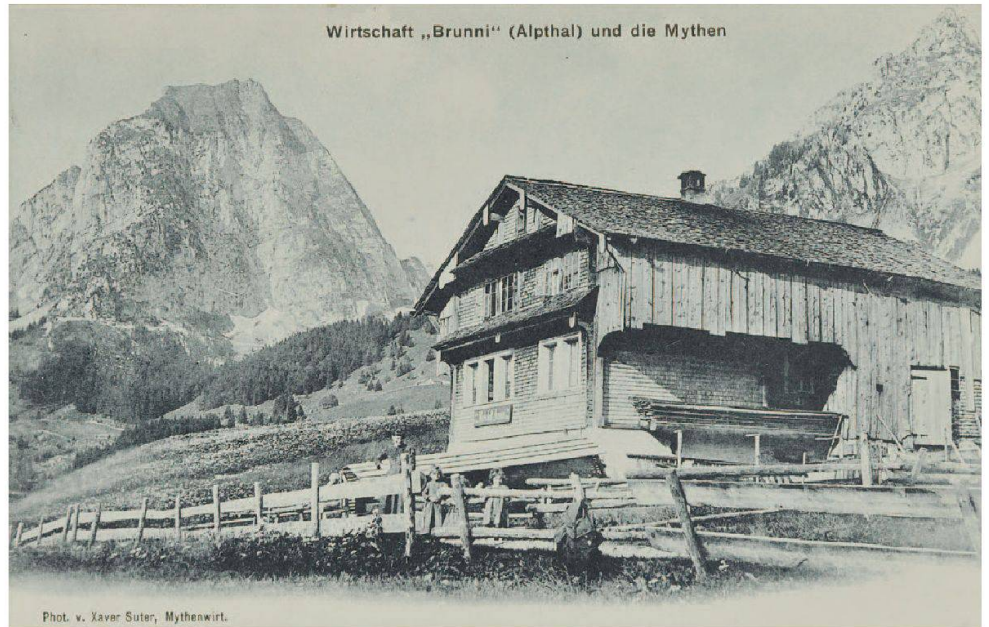
Abb. 5: Das im Verlauf des letzten Jahrhunderts stark veränderte ehemalige Gasthaus Brunni an der Lümpenenstrasse 5 war ursprünglich ein typisches Innerschweizer Tätschdachhaus der ersten Hälfte des 19. Jahrhunderts. Es dürfte nach 1826 unter Josef Franz Fässler, dem damaligen Besitzer der Liegenschaft, errichtet worden sein. Der verschindelte Blockbau weist zwei Vollgeschosse und seitliche Lauben auf. Die vorstosslose Hauptfassade zeigt zwei Fensterachsen und Klebdächer. Ansichtskarte von Xaver Suter, vor 1907.