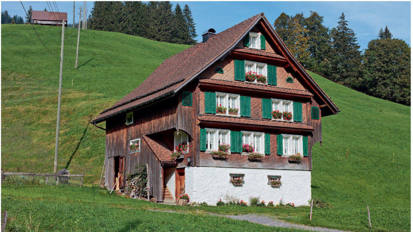
Abb. 6: Die gemäss Bauinschrift 1842 unter dem damaligen Besitzer Josef Anton Steiner-Schuler (*1810) errichtete Gross Schnüerlismatt am Schnüerlismattweg 2 ist ein Vertreter des steilgiebligen Blockbau-Typs mit ausgebauten Giebelgeschossen und Klebdächern an der Hauptfassade.