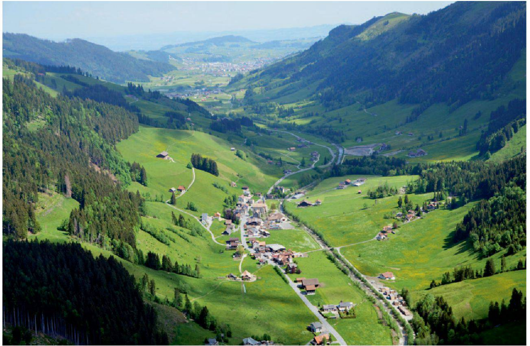
Abb. 1: Luftaufnahme des Dörfli Alpthal nach Norden gegen Einsiedeln.