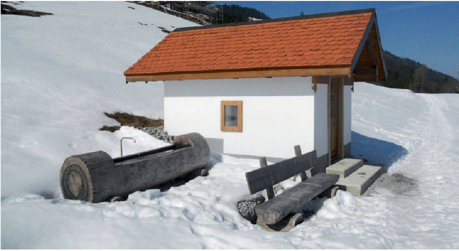
Abb. 3: Die 2010 renovierte Kapelle St. Anna auf den Brüglen, Brunni, ist eine typische einfache Wegkapelle, deren Grundsubstanz ins 19. Jahrhundert zurückreicht, und der erste Sakralbau ausserhalb des Dörfli. Sie liegt am alten Verbindungsweg in den Weiler Brunni.