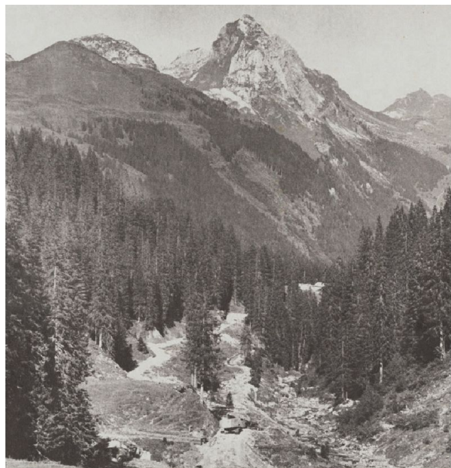
Abb. 4: Aufnahme beim Bau der Prugelstrasse durch das Militär beim Klöndurchlass, Richtung Glarner Grenze, zwischen 1970 und 1974. Die Militär-, Alp- und Forstwirtschaftsstrasse weist gegenüber allen früheren Projekten und dem Saumpfad eine neue Strecken-Führung auf, zum Beispiel auf der westlichen Pass-Seite vom Roggenloch her durch den Bödmerenwald, nicht direkt zum Prugelpass.