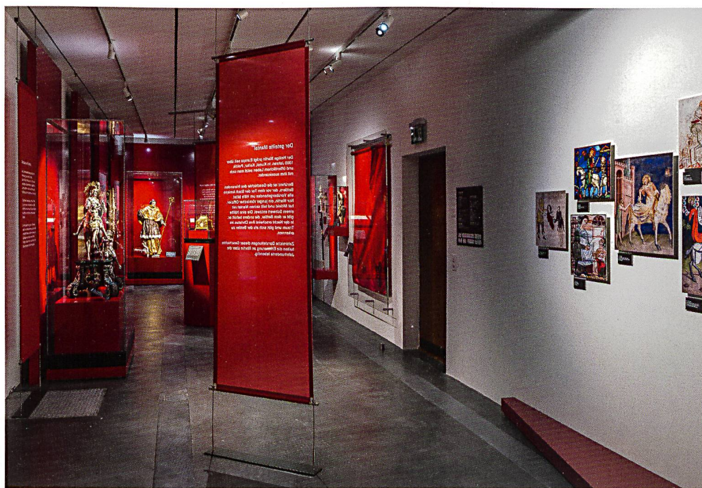
Abb. 1: Blick in die Ausstellung der Schwyzer Museumsgesellschaft, 2016. Anhand ausgesuchter Objekte wurde in erster Linie die Bedeutung Martins für Schwyz erklärt.