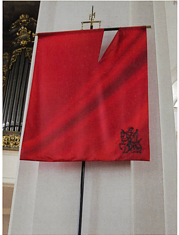
Abb. 20: Prozessionsfahne der römisch-katholischen Pfarrei St. Martin. Das rote Tuch erinnert an den Mantel Martins, der Schnitt oben an die Mantelteilung (Szene unten rechts).

Den Abschluss der Ausstellung der Schwyzer Museums-gesellschaft im Bundesbriefmuseum bildete die Fahne der Pfarrkirche Schwyz. Diese Fahne ist eine sehr reduzierte Darstellung der Mantelteilung: Ein rotes Tuch erinnert an den Mantel Martins, der Schnitt oben an seine Teilung. Der Besucher wurde damit zum Schluss noch einmal mit der Geschichte der Mantelteilung konfrontiert, jetzt allerdings