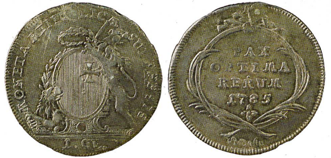
Abb. 16: Gulden von 1785, Durchmesser im Original: zirka 3.3 cm. Zu sehen ist hier nicht mehr der Landespatron, sondern zwei Löwen mit dem Schwyzer Standesschild.