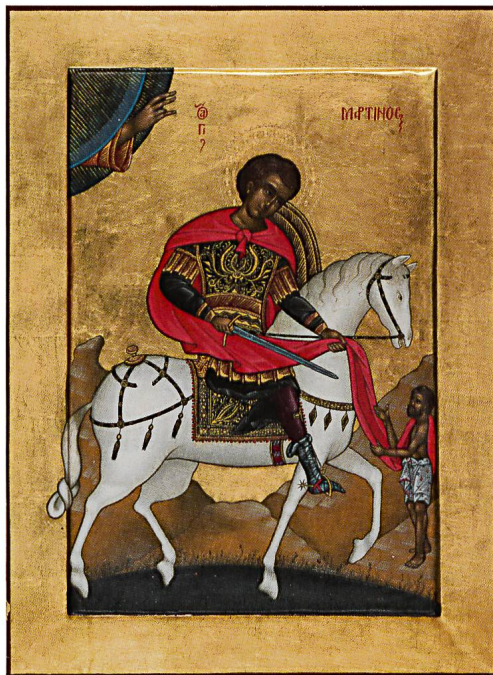
Abb. 5: Altarbild des Hochaltars in der Pfarrkirche Schwyz von 1774.