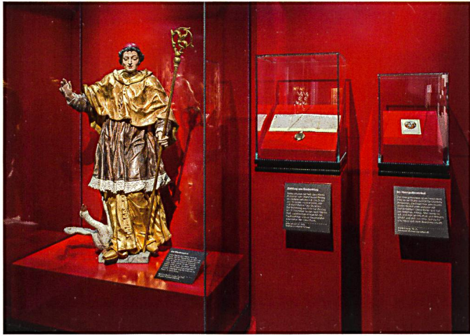
Abb. 17: Statue um 1720 von Martin als Bischof mit Gans, die von der Zinsgabe in den Rang eines Heiligenattributs aufstieg.

der übliche Zinstag 66 und gemäss dem Zivilgesetzbuch werden an Martini die Winterwege geöffnet, ab dem 11. November dürfen die Wiesen also von Mensch und Vieh betreten werden. 67 Ausdruck der ökonomischen Bedeutung sind auch die Märkte, die am Martinstag stattfanden und wo das Gesinde neue Arbeitgeber suchte, Verträge abgeschlossen, Vieh gehandelt und durch Verkäufe das Geld für die Pachten und Zinsen gewonnen wurden. 68 Noch heute findet am oder um den 11. November an verschiedenen Orten auch im Kanton Schwyz ein Martini-markt statt.