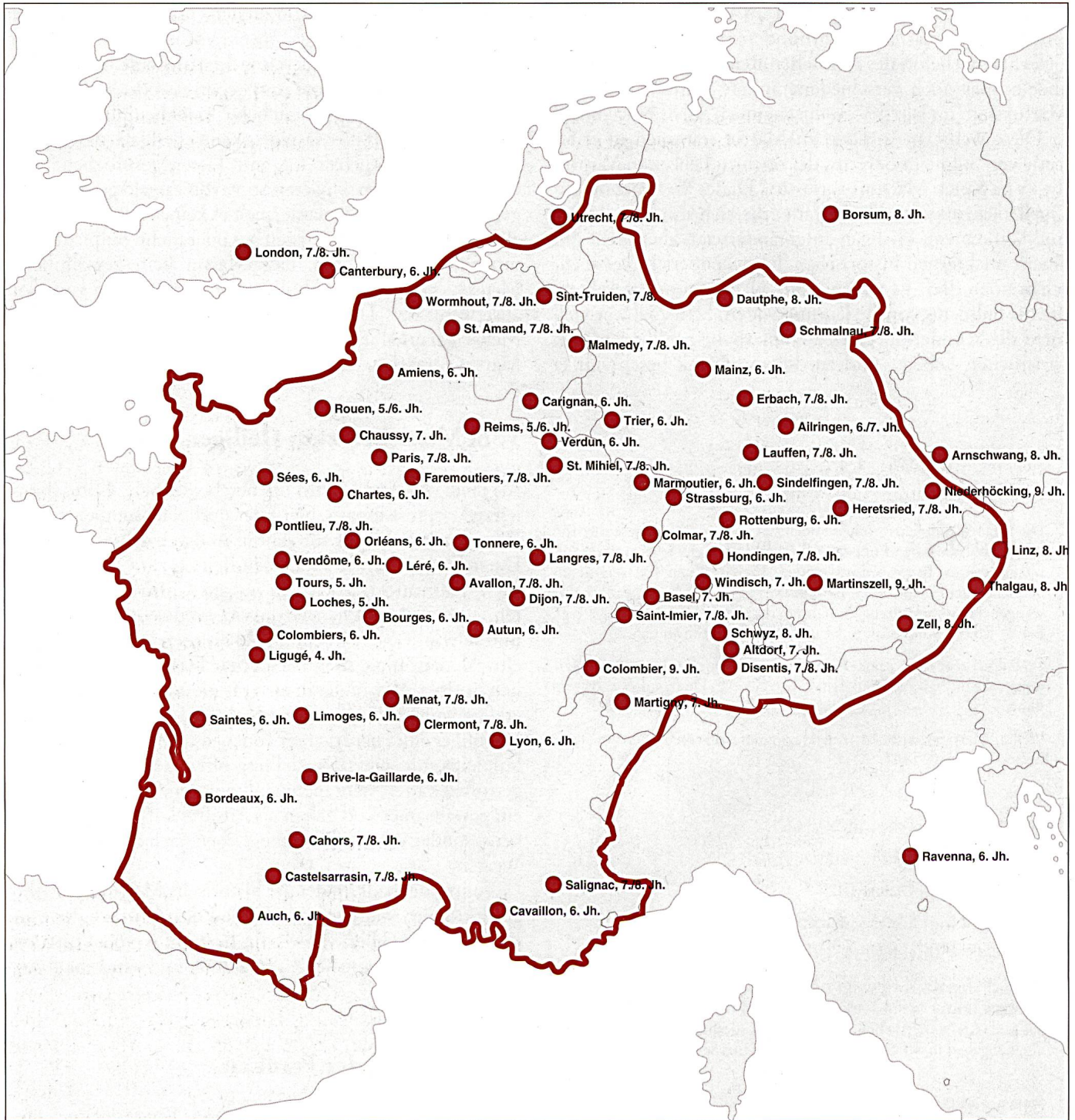
Abb. 4: Die Karte zeigt dem Heiligen Martin geweihte Kirchen, Kapellen und Klöster im fränkischen Reich vom 6. bis zum 9. Jahrhundert. Sie gibt einen Eindruck über die weite Verbreitung der Martinsverehrung, ist aber nicht vollständig; eine abschliessende Auflistung wäre zu umfangreich.