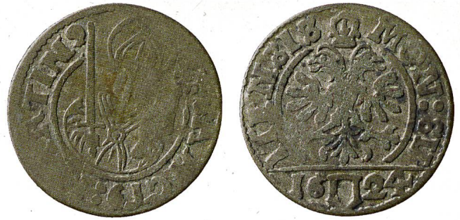
Abb. 15: Schilling von 1624, Durchmesser im Original: zirka 2 cm, mit Martin als Bischof, kenntlich gemacht durch die Umschrift: SANCT [US] MARTIN[US].

Allerdings erschien Martin sehr viel später noch einmal auf Schweizer Geld. Die Hunderternote der Banknotenserie, die von 1956 bis 1973 in Umlauf war, zeigte den Heiligen, wie er seinen Mantel mit einem Bettler teilt. 60 Wie mittelalterliche Münzen sind auch moderne Banknoten nicht nur ein Zahlungsmittel, sondern vielmehr eine Art Visitenkarte eines Landes. Im Falle dieser Hunderternote steht allerdings wohl weniger staatliche Repräsentation im Zentrum als ein moralischer Mehrwert: Die Botschaft dieses Geldscheins könnte lauten, man solle sich am Geld nicht erfreuen, sondern barmherzig wirken und es teilen. 61