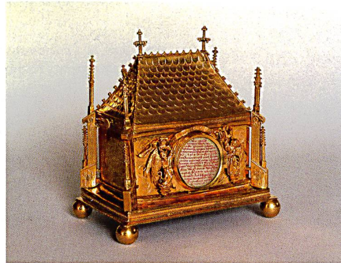
Abb. 10: Prozessionsfigur Martin, um 1760, in der Ausstellung der Schwyzer Museumsgesellschaft.