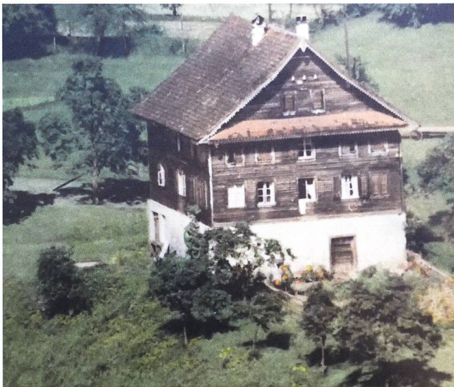
Abb. 2: Luftaufnahme, 1954. Auf dem Bühlhof in Greppen LU wurde 1853 mehrere Wochen lang eine unverheiratete schwangere Frau versteckt, die dann dort heimlich ein Mädchen gebar. Ein paar Wochen später wurde dieses vor der Kirchentür von Gersau ausgesetzt. Erst eineinhalb Jahre später lüftete sich das Geheimnis um diese Kindesaussetzung.

Abb. 1: Der Bezirksrat Gersau stellte für die Entdeckung der Mutter des ausgesetzten Kindes sowie der Täterschaft eine Prämie von Fr. 200.– in Aussicht. Diese Anzeige wurde in der «Schwyzer Zeitung», im Amtsblatt (hier abgebildet) und in zwei ausserkantonalen Zeitungen publiziert.