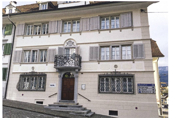
Abb. 2: Schwyz, Haus Hauptplatz 11: Hauptfassade, Ansicht von Westen.

Die Fassaden des herrschaftlichen Hauses am Hauptplatz 11 in Schwyz wurden vor rund 50 Jahren restauriert. Die Bauherrschaft wünschte sich eine erneute Auffrischung und Instandstellung. In einem ersten Schritt reinigte man die Unterdachansichten wie auch die verputzten Fassadenflächen. Danach wurden Risse und Salzausbildungen vorbehandelt und geflickt. Sämtliches Holzwerk wurde mit Laugenwasser gereinigt, angeschliffen und mit Ölfarbe neu gemalt. Die Farbenfassung orientierte sich am bestehenden Farbenkleid. Nebst den Fassadenflächen und dem