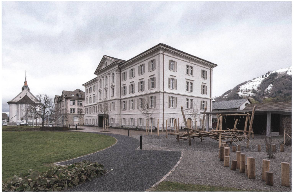
Abb. 3: Arth, Altersheim und Kindergarten Hofmatt: Hauptfassade, Ansicht von Süden.

und zur Schulanlage Hofmatt/Zwygarten. Es handelt sich um einen viergeschossigen stattlichen Bau im Stil des Spätklassizismus mit dreiaxsigem leicht erhöhtem Mittelbau, an den die je vierachsigen Seitenflügel anschliessen. Der Sockelbereich geht über zwei Geschosse und besticht durch eine rustizierte Gestaltung aus Sandstein. Die untersten etwas kleineren Fenster weisen einen rundbogigen Abschluss auf, während die darüber folgenden Fensterreihen gleichmässig die Fassaden gliedern. Der mit einem glatten Putz gestaltete zweigeschossige Oberbau wird seitlich von einfachen Lisenen abgeschlossen. Der Mittelrisalit ist über dem Sockelgeschoss reicher gestaltet; so gliedern korinthische Säulen die hohen Fensteröffnungen, und ein prächtiges Tympanon mit einem zentralen Rundfenster bildet den oberen Abschluss. Der Bau wird von einem mächtigen Walmdach abgeschlossen.