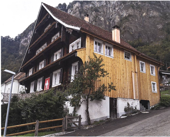
Abb. 4: Muotathal, Wohnhaus Wil 41: Seitenfassade mit Neuverschalung, Ansicht von Südosten.