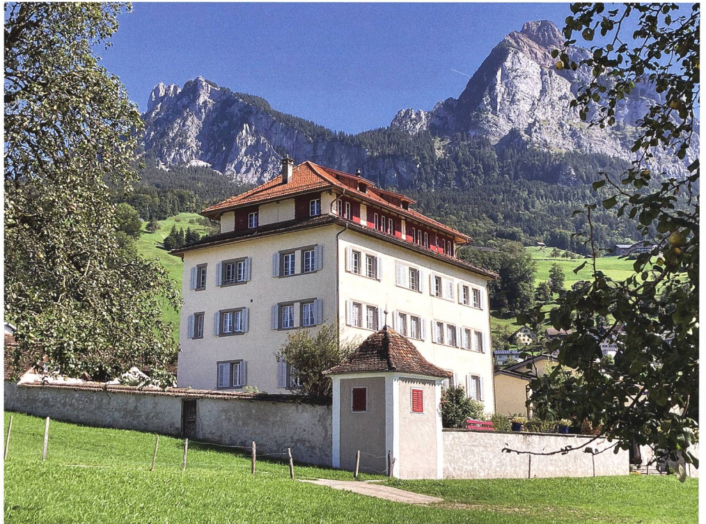
Abb. 1: Schwyz, Haus Ceberg im Feldli, Ansicht von Südwesten, mit Hauptfassade (besonnt).

Die Denkmalpflege wurde frühzeitig in die Planung der umfassenden Fassaden- und Dachrestaurierung involviert. In einem ersten Schritt erfolgte eine Beurteilung der bestehenden Fassaden und deren Altbeschichtung mit baustellenüblichen Tests. Danach wurden die Fassaden gründlich