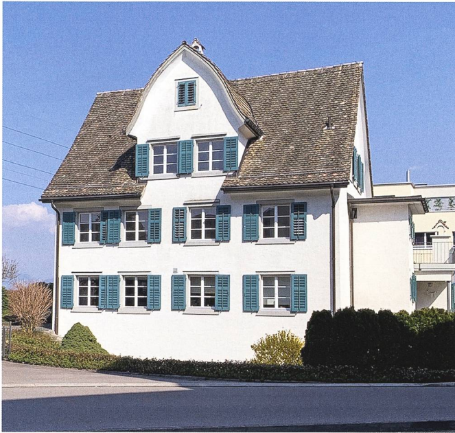
Abb. 5: Altendorf, Haus Hirschen, Brügglistrasse 1: Hauptfassade, Ansicht von Westen.

zu einem Wohnraum ausgebaut werden, vorerst ohne spezifische Nutzung. Die Dachkonstruktion wurde wo nötig repariert, innenseitig gedämmt und mit grossformatigen Holzplatten verkleidet. Die Platten bilden die mehrfach geknickte Dachform nach und sind mit einem handwerklich kunstvollen Fugenbild ausgeführt worden. Die Eingriffe im Haus sind kaum sichtbar und sprechen für einen sorgfältigen Umgang mit der Bausubstanz. Durch den Umbau und die Restaurierung hat das Schutzobjekt an Bedeutung und Authentizität gewonnen.