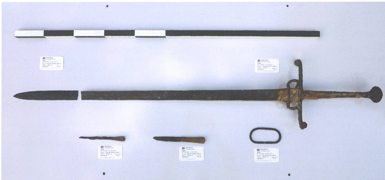
Abb. 4: Der Fundkomplex nach der vom Dezember 2020 bis Mai 2022 erfolgten Konservierung im Sammlungszentrum des Schweizerischen Nationalmuseums in Affoltern am Albis.

an den beiden Enden in ebenfalls tordierte runde Köpfe ausläuft. Zur Klinge hin befindet sich aussenseitig ein Parierstange, der mit einer schräg verlaufenden Fingerauflage innenseitig verbunden ist. 6 Die Klinge ist gerade, verjüngt sich stetig zum Ort hin und ist beidseitig doppelt gekehlt (vertieft). Auf der Hilze (Griff) haben sich noch Holzreste, an der Fehlschärfe der Klinge Leder- und wiederum Holzreste der ursprünglichen Schwertscheide erhalten.