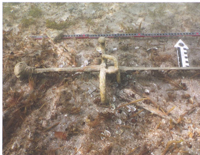
Abb. 3: Seitliche Fundansicht des Schwertes; vorne das parallel liegende Schwertbesteck bestehend aus Beimesser und Esspfriem.