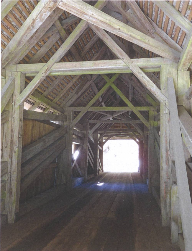
Abb. 3: Blick in die 2011 restaurierte Suworow-Brücke mit der Holzkonstruktion von 1810.