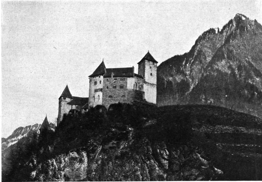
Burg Gutenberg im Fürstentum Liechtenstein