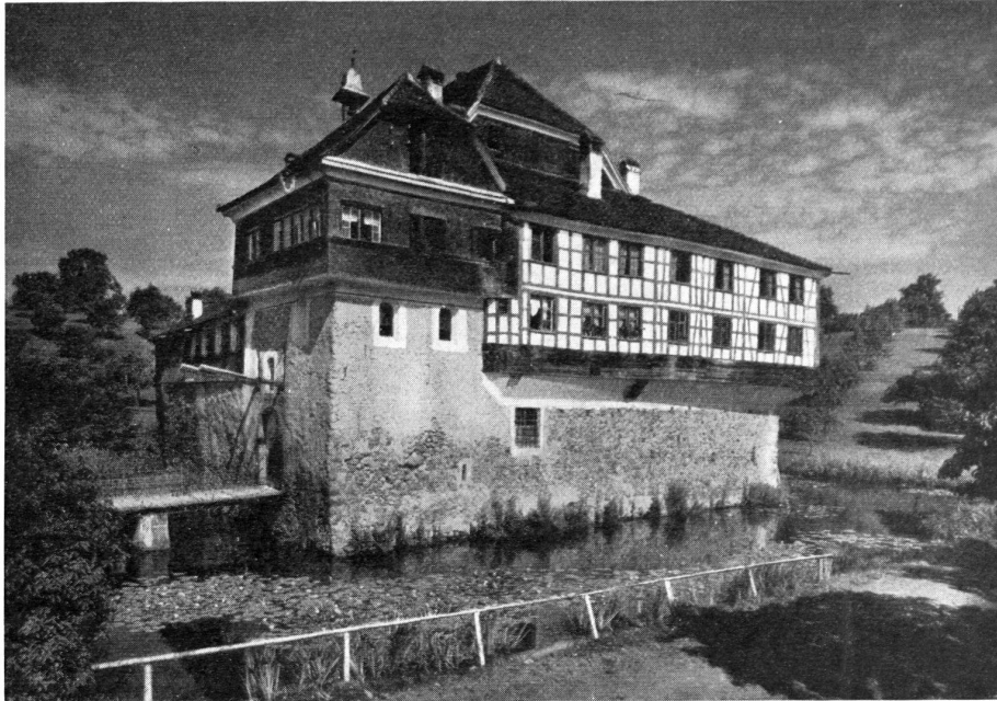
Die Wasserburg Hagenwil