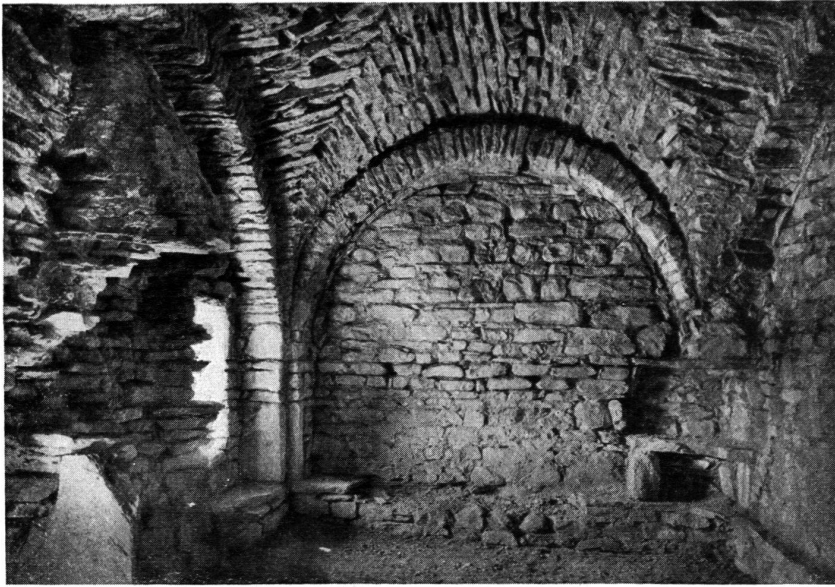
Turm von Santa Maria Calanca. Inneres des einen der beiden sich gleichenden Obergeschosse. Links Reste eines Kamins.