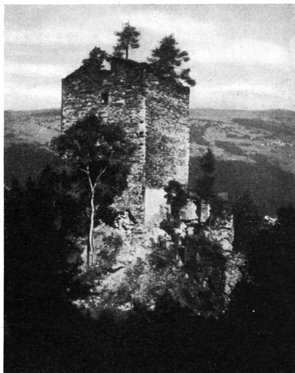
Der Turm der Ruine Ehrenfels

Und nun zogen Ende Juli 25 junge arbeitsbegeisterte Leute, alles Basler im Alter von 18—22 Jahren, auf die Ruine und haben dort unter Anleitung eines Sachverständigen angefangen, das Unterholz auszuroden und die verschütteten Teile auszugraben; sie führen auch Schutt ab, tragen Holz, Kalk, Zement und Steine, Sand und Wasser von der Strasse hinauf (Fahrweg gibt's nicht) und sind so damit beschäftigt, die Ruine instandzustellen. In dem noch bis auf die ursprüngliche Höhe erhaltenen Hauptturm sollen in diesem Jahr noch die Zwischenböden wieder eingezogen und das Dach aufgesetzt werden, während die weiteren Wiederherstellungsarbeiten und der komplette Ausbau der Burg zu einer Jugendburg für nächstes Jahr in Aussicht genommen ist, sofern die notwendigen Mittel bis dahin durch die Geldsammlung eingegangen sind.