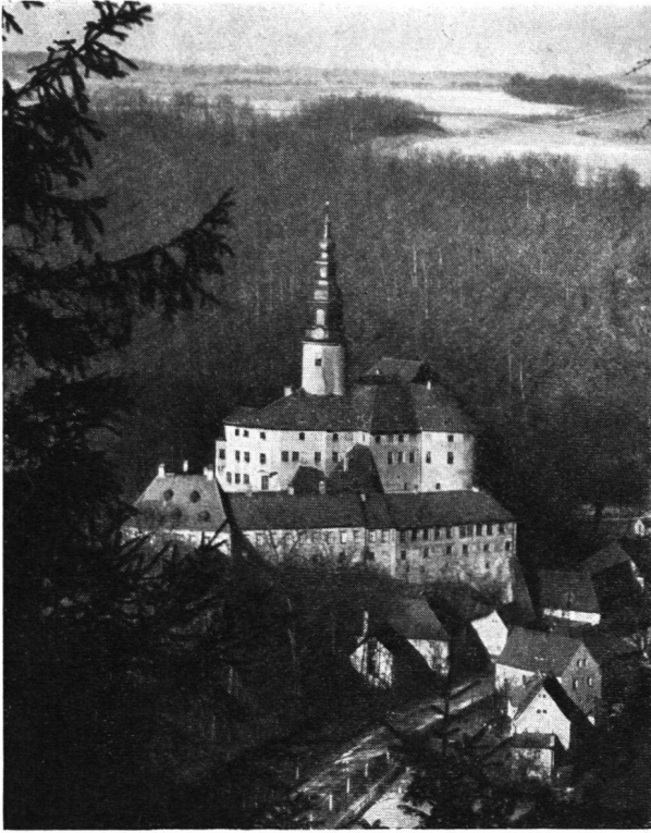
Die Burg Weesenstein in Sachsen, welche kürzlich in den Besitz des „Landesverein Sächsischer Heimatschutz“ übergegangen ist