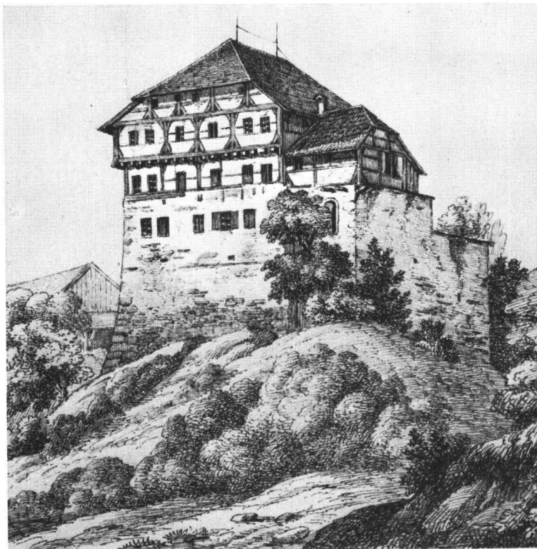
Zuckenriet nach einer Federzeichnung von J. J. Rietmann 1848

Wer im Postauto von der st. galischen Bundesbahnstation Wil nach Bischofszell sich begibt, erlebt in einer starken Stunde eine Burgenfahrt im kleinen: Er umfährt die Süd- und Ostflanke der Altstadt Wil , auf deren höchstem Punkte der Fürstabt Ulrich VIII. von St. Gallen auf der Stelle des ehemaligen gräflich toggenburgischen Schlosses das mächtige Hofgebäude errichten ließ; er erblickt nach viertelstündiger Fahrt über der Kirche von Zuzwil , die auf ihrem hohen Standort mit der Friedhofmauer wie eine befestigte Kirche sich ausnimmt, hoch oben am Berg hang einen merkwürdigen Gelände-einschnitt: den Graben der einstigen Burg der „Löwen von Zuzwil“, um sich nach weiteren 20 Minuten Fahrt vom Anblick des noch so wohl erhaltenen Schlosses der „Löwen von Zuckenriet“ überraschen zu lassen und nach einer letzten halben Stunde des Schlosses weiland des Fürstbischofes von Konstanz in seiner Stadt Bischofszell ansichtig zu werden, von der aus dieser so manchmal den Fürstabt von St. Gallen bedroht hat.