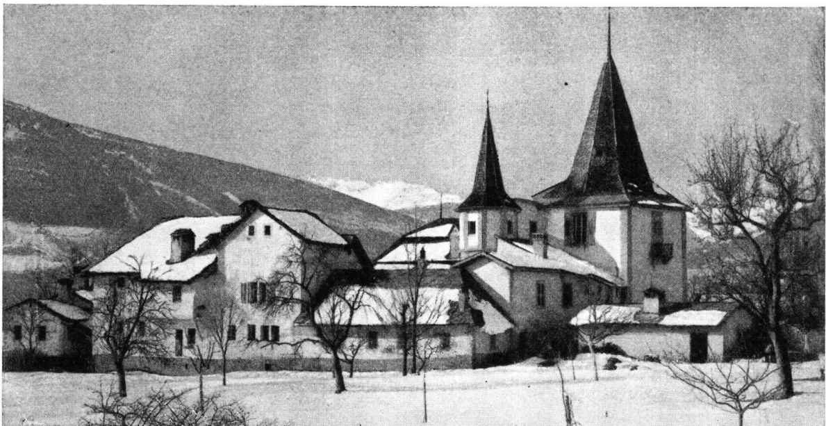
Château de Preux, Les Anchettes sur Sierre