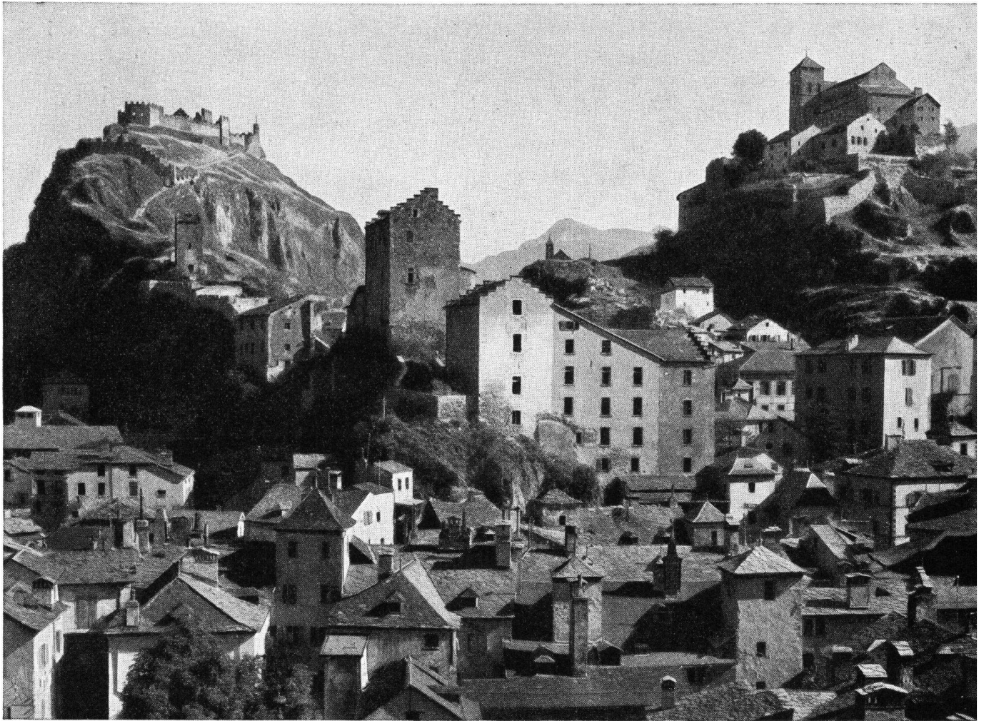
Gesamtansicht von Sitten. Links oben Tourbillon, Mitte Majoria, rechts Valeria