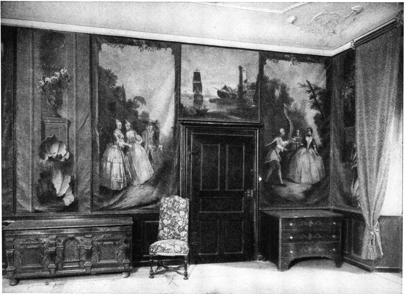
Maison Eugène de Courten, Sierre. Le salon