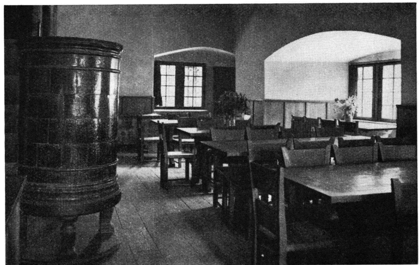
Der Eßraum in der Jugendburg Rotberg . Der grüne Kachelofen stammt aus einem abgebrochenen Bürgerhaus in Basel

Mit dem Wunsche, daß sich die schöne Rotbergtradition weiterhin fortsetze und daß noch immer mehr Jugendliche auf der ersten schweizerischen