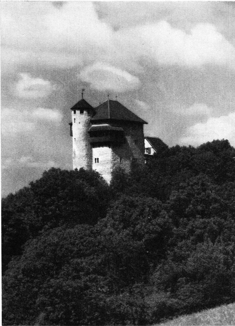
Die wiederaufgebaute Burg Rotberg

Jugendburg unvergeßliche Stunden verbringen können, möchten wir unsere Ausführungen schließen, um noch an Hand einiger Zahlen die Zunahme der Frequenz des Rotbergs zu zeigen. Im letzten Jahre besuchten 2786 Jugendliche die Burg, und der Verwalter konnte 2910 Übernachtungen buchen. Darunter befanden sich 16 Schulen und 71 Gruppen. Dieses Jahr dürfte die Zahl 3000 bereits überschritten werden. Das Werk, das der Schweizerische Burgenverein seinerzeit mit soviel Anteilnahme gefördert hat, wirkt sich zum Wohle der Jugend aus. S.