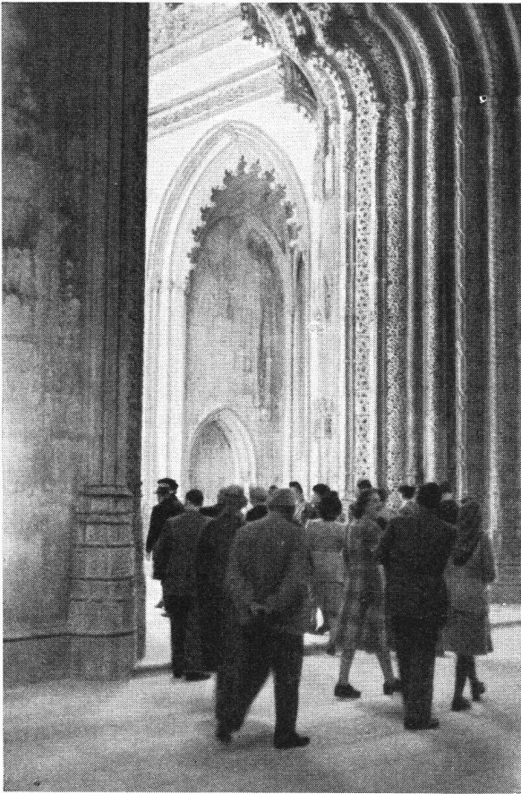
Starken künstlerischen Eindruck vermittelt das Innere der Klosterkirche von Batalha mit seiner äußerst feinen Architektur