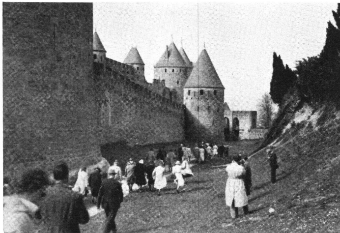
Carcassonne. Spaziergang im Stadtgraben und um die Burg

Als im letzten Herbst eine Anzahl Mitglieder des Schweizerischen Burgenvereins den Entschluß faßte, die früher so beliebt gewesenen Auslandfahrten wieder aufzunehmen und als erste nach dem Krieg eine Reise nach Portugal zu unternehmen, begegnete diese Idee in den Kreisen der Burgenfreunde einiger Verwunderung, weil es für ausgeschlossen galt, daß bei den vielen Schwierigkeiten, die insbesondere die Grenzübergänge, sowie die Unterkunft und Verpflegung zur Zeit noch bieten, eine solche Reise jetzt schon durchführbar sei. Der Versuch wurde gemacht und — gelang. In drei schönen Autocars der Firma Winterhalder fuhren Ende März 82 Teilnehmer der französischen Grenze entgegen und erreichten über Avignon, Nîmes, Carcassonne, Toulouse, San Sebastian nach