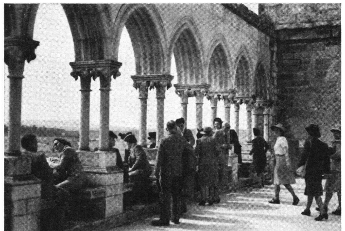
Von einem der Säle der Burg Leiria genießt man eine herrliche Aussicht

Sodann geben wir nachstehend die französische Übersetzung eines Artikels, der im „Diario de Noticias“, der bedeutendsten Tageszeitung Lissabons, erschienen ist und uns von unserem dortigen Gesandten, Herrn Minister M. Jaeger, in liebenswürdiger Weise zugestellt wurde.