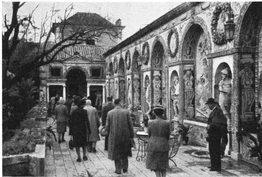
Beim Besuch der Villa Fronteira des Marchese Torre bei Lissabon bestaunt man u. a. auch die wundervolle bunte Majolika-Architektur des Gartens