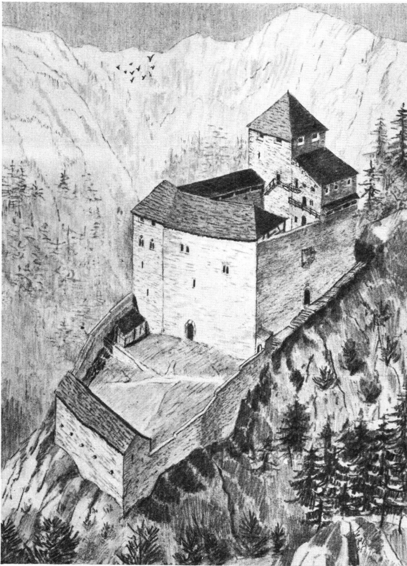
Belfort vor der Zerstörung 1499.