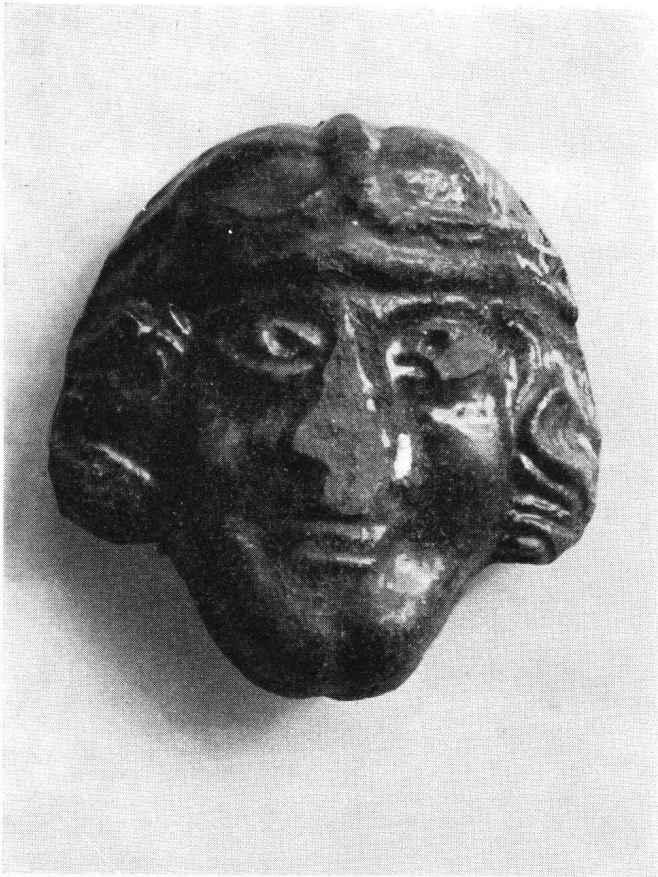
Glasiertes Tonköpfchen (Ofenkachel), 14. Jahrhundert, 1. Hälfte

die Augen schräg gestellt und der Mund entweder zu einem Lächeln oder in eine O- beziehungsweise Blasstellung verzogen. Eines der Köpfchen trägt im Unterschied zu den andern sehr archaische, fast romanische Züge. Hinten waren dicke, rund 10 cm lange Einsteckpfropfen angebracht, die, wie auch die Köpfchen, braun oder olivgrün glasiert sind. Trotzdem die Aufarbeitung des Riedburgmaterials noch nicht abgeschlossen ist, kann eine Datierung in die erste Hälfte (eventuell zweites Viertel) des 14. Jahrhunderts als richtig angenommen werden. Eine kunsthistorische Bearbeitung möchten wir schon jetzt in Aussicht stellen.