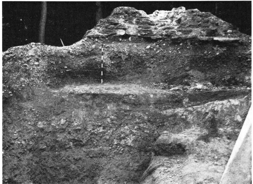
Oben: Rest der «Schildmauer» auf abgeschrotetem Nagelfluhfels, Hasenburg. Unten: Mauer des Hauptgebäudes auf abgeschrotetem Sandstein, Hasenburg