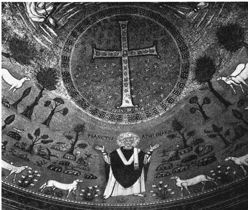
Ravenna, S. Apollinare in Classe, Apsis

Einen letzten, krönenden Akzent, ehe man nach Mailand und kurz danach in die heimatlichen Gefilde zurückkehrte, setzte der in allen Teilen gelungenen Reise ein Besuch in der Herzogs- und Festungsstadt Mantua; das gewaltige, aus verschiedenen Baukörpern sich fügende Gonzaga-Schloß entfachte dort als Ganzes so sehr das Interesse, wie die Ausschmückung einzelner Gemächer, vor allem jene der berühmten «Camera degli Sposi» durch den genialen Mantegna, Begeisterung weckte.