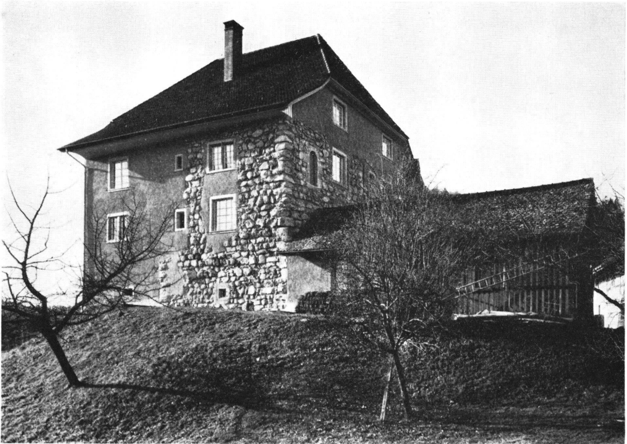
Pfarrhaus Schlatt bei Rätterschen