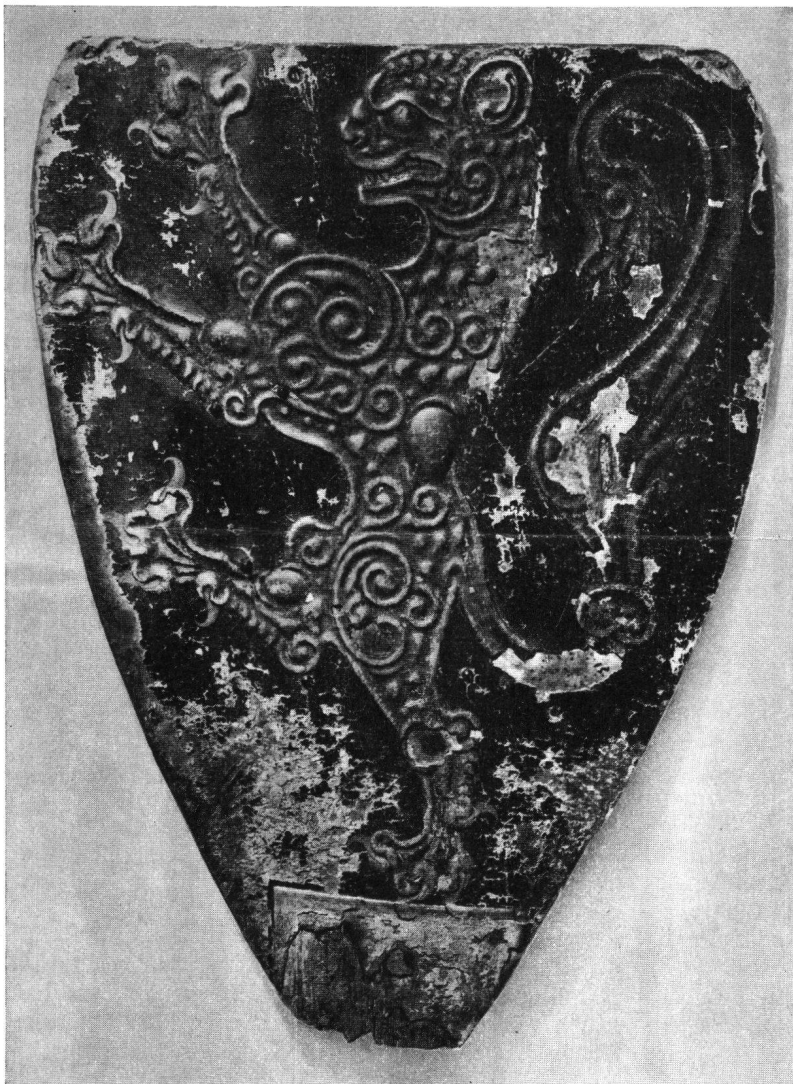
Der Reiterschild von Seedorf, 12. Jahrhundert, 2. Hälfte. Vorderseite im heutigen Zustand. Im Schweiz. Landesmuseum

Wenn wir uns gestatten, einen kleinen Hinweis auf ein Buch zu geben, welches nicht direkt mit Burgen im Zusammenhang steht, so tun wir es deshalb, weil das in dieser wissenschaftlichen Arbeit behandelte Material, der mittelalterliche Reiterschild des Abendlandes, einen wesentlichen Bestandteil der Bewaffnung des adeligen Kriegers, der seinen Wohnsitz normalerweise auf einer Burg hatte, darstellte.