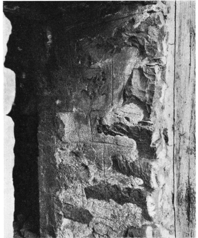
Bürglen UR Eingang zum Turm 3 mit mittelalterlichem Fugenstrich

Aus dem beigelegten Situationsplan geht hervor, daß die Türme weder gleiche Grundrisse noch gleiche Mauerstärken aufweisen. Ebenso ergab ein persönlicher Augenschein, daß die Mauertechnik bei den drei Türmen, von denen noch aufsteigendes Mauerwerk erhalten blieb, verschieden ist. Sie sind demnach nicht in der gleichen Zeit gebaut worden und können nicht zu einer einheitlichen Talsperre, wie es von früheren Historikern angenommen wurde, gehört haben. – H. Sr. Literatur: H. Zeller-Werdmüller, Denkmäler aus der Feudalzeit im Lande Uri, Mitteilungen der Antiquarischen Gesellschaft in Zürich, Band 21; P. Kläui, Die Meierämter der Fraumünsterabtei in Uri, Histor. Neujahrsblatt Uri 1955/56 S. 7; P. Kläui, Bildung und Auflösung der Grundherrschaft im Lande Uri, Histor. Neujahrsblatt Uri 1957/58 S. 40.