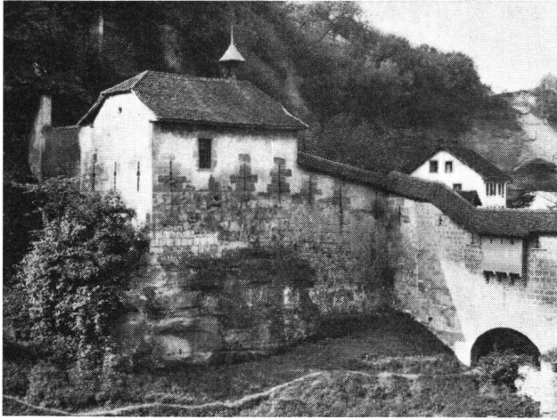
Freiburg Ringmauer. Kapelle St-Béat, nach der Restauration 1937. Aufn. Macherel, Freiburg

au milieu du XIII e siècle. Il estime que c'est un fait remarquable de voir apparaître à Fribourg à cette époque un dispositif de défense qui ne s'est répandu en Europe qu'à la fin de ce siècle. Zemp écrit (op. cit.) que la tour du Durrenbühl a été construite à la fin du XIV e siècle, peut-être en utilisant les fondations d'une tour antérieure.