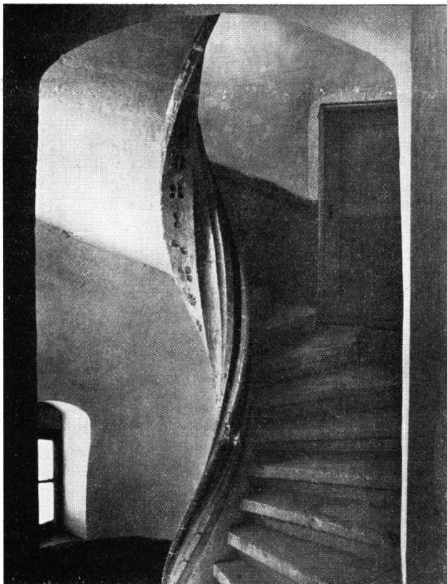
Schloß Pruntrut, Wendeltreppe Residenzgebäude

1961 sind die Restaurierungsarbeiten am Schloß, für welche das Bernervolk am 2. September 1956 einen Kredit von 2 Millionen Franken bewilligt hatte, abgeschlossen worden.