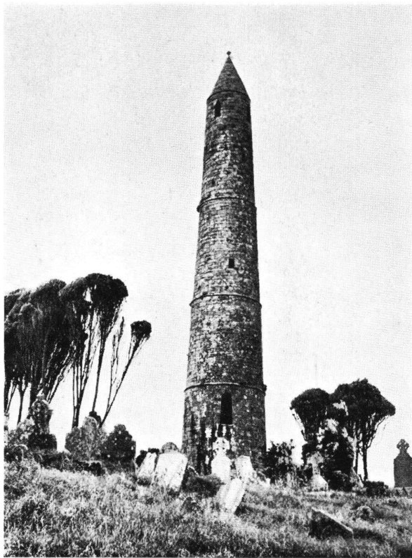
Abb. 3 Turm von Ardmore (Irland) 9. Jh.

Etwa gleichzeitig entwickelte auch die karolingische Architektur in nördlichen Ländern Kirchtürme, die im Gegensatz zu Italien nicht irgendwo nebenan standen, sondern aus der Eingangsfassade der Kirche emporstrebten. Diese meist symmetrischen «Westwerke» umfaßten zwei kürzere Türme, oft vermehrt, wie in Hildesheim, um einen die Eingangshalle überragenden Mittelurm.