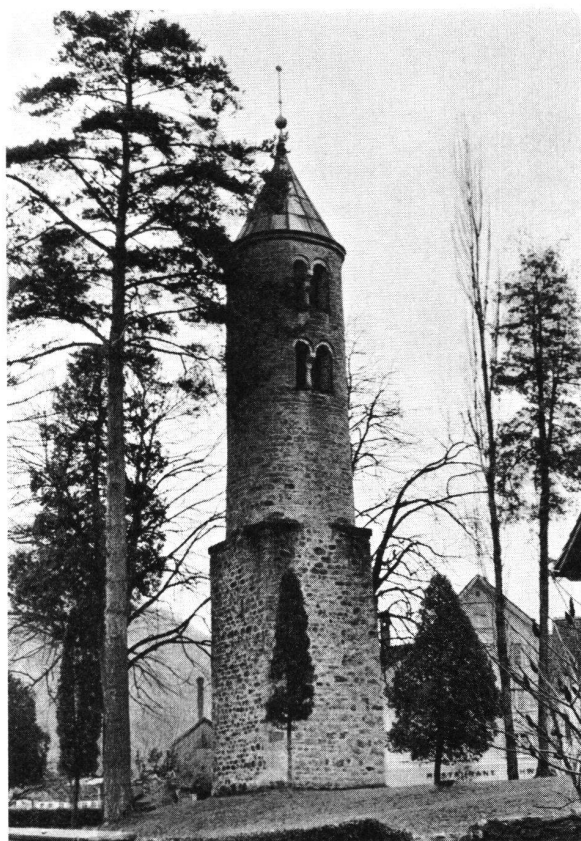
Abb. 2 Turm der 1824 abgebrochenen Galluskapelle in Schänis SG. Der quadratische Sockel wurde früher als römischer Wachturm gedeutet. Der ganze Bau stammt jedoch aus dem Mittelalter, wohl 10./11. Jh.

Wie der Turm zum weithin sichtbaren und damit wichtigen Teil unserer Kirchen geworden ist, entzieht sich noch immer genauerer Kenntnis. Antiken Tempeln und Sakralbauten aller Art war der Turm fremd. Ebenso den frühchristlichen Kirchen und Baptisterien. Doch plötzlich, im 9. Jahrhundert, ist er da!