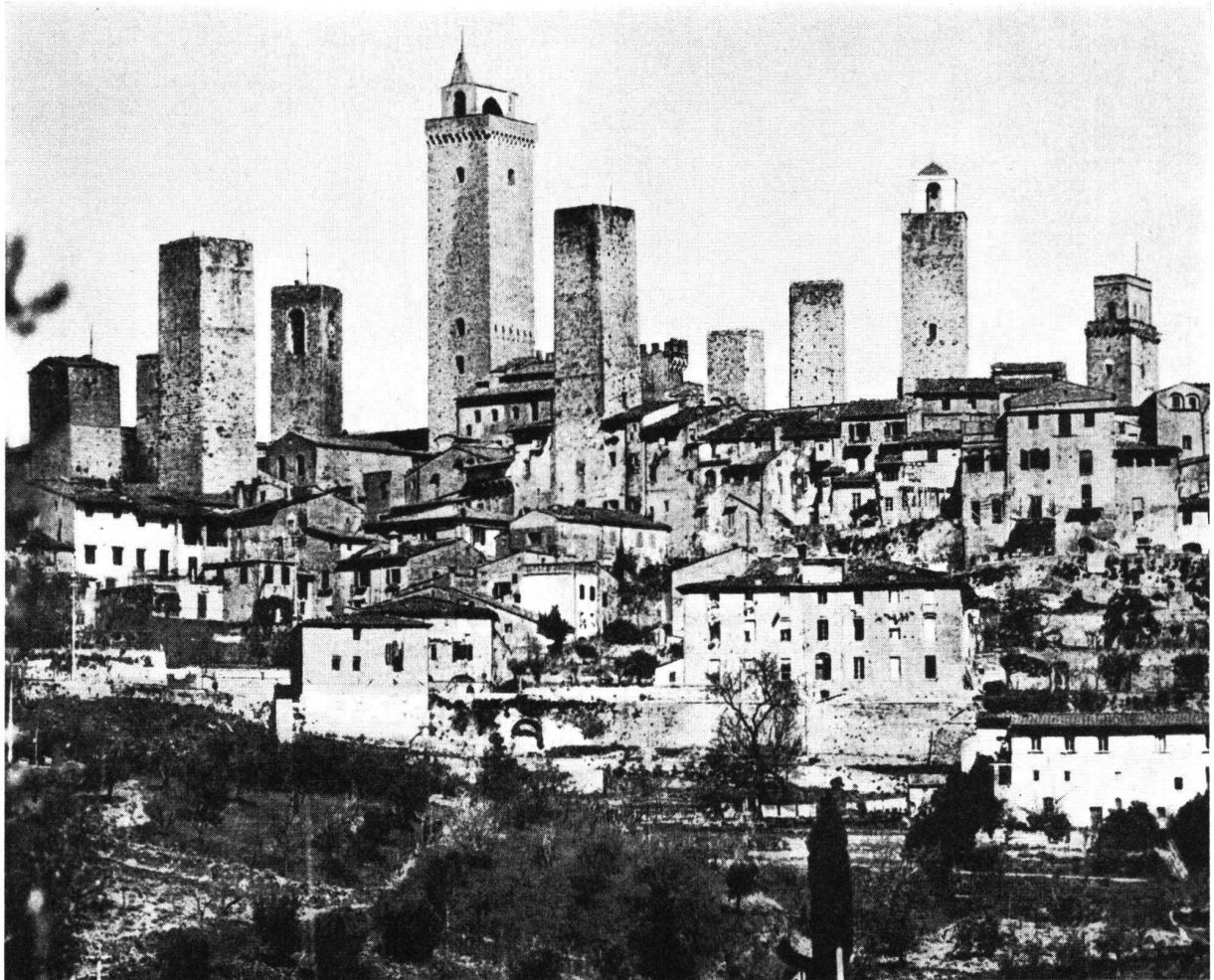
Abb. 5 Die toscanische Bergstadt San Gimignano, touristische Attraktion dank ihrer Geschlechtertürme aus dem Mittelalter.

eines Herrschaftsbezirks. Auch in diesem Fall sind Zweifel berechtigt! In Nr. 4/63 des Mitteilungsblattes des Schweiz. Burgenvereins stellt A. Moser fest, daß es kaum denkbar sei, wie mit einzelnen, nur für eine ganz kleine Besatzung geeigneten Türmen oder Schließchen wirksame Sperrfunktionen für ganze Talschaften hätten erfüllt werden sollen. Auch Dr. Hugo Schneider kommt in Nr. 2/64 «Der militärische Wert von Burgen» zu übereinstimmenden Feststellungen.