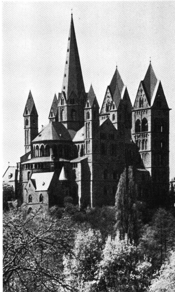
Abb. 4 Limburg an der Lahn (Deutschland) Dom, Übergang von der Romanik zur Gotik, 1235 geweiht.

Die Kirchtürme sind, wie bereits dargelegt, erst in späterer Zeit als Glockenträger verwendet worden. Hochgelegene Turmkapellen, wie im Projektplan des Klosters St. Gallen vorgesehen, fanden keine Verbreitung. So bleibt nur noch die Verwendung als Beobachtungspunkt gemäß dem St. Galler Planvermerk. Dafür hätte man nur einen Turm gebraucht. Wenn wir berücksichtigen, wie weltabgekehrt ein frühmittelalterliches Kloster organisiert war, kann auch diese Funktion als Hauptzweck nicht überzeugen, selbst in den Zeiten der Einfälle von Ungarn und Sarazenen. Noch