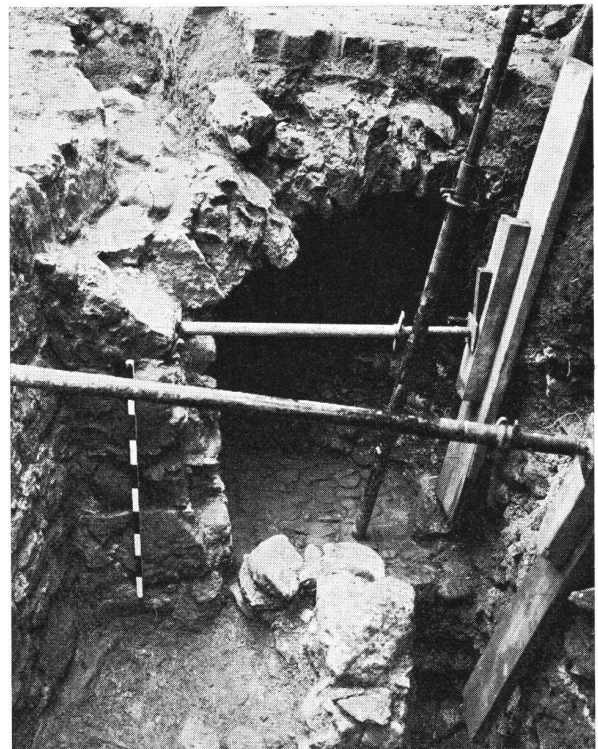
Zug Burg. Die Brücke im Südwesten der Burg. Sie wurde an Stelle einer früheren Holzbrücke über den Burggraben errichtet. Das Gewölbe sowie das gepflasterte Bett für den damals durch den Burggraben geleiteten Bach, sind sehr schön erhalten. Die ganze Anlage war bei ihrer Entdeckung vollständig mit Schutt aufgefüllt.

Die Auswertung der vielen Zeichnungen und Photographien erfordert einen beträchtlichen Zeitaufwand. Eine Publikation ist vorgesehen. Es konnten dem Auftrag gemäß wertvolle Erkenntnisse für die zukünftige