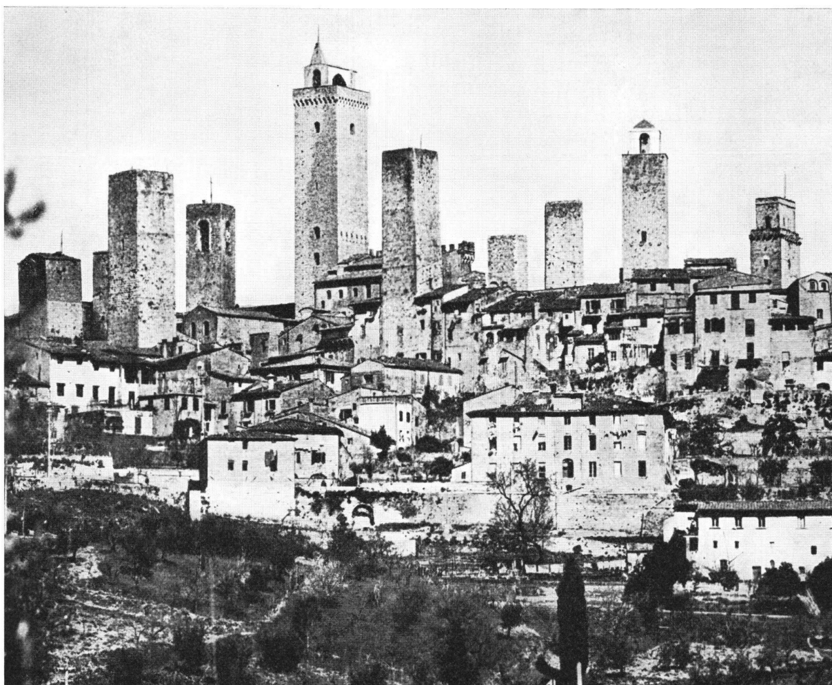
San Gimignano Italien. Im Mittelalter wurden die Silhouetten vieler italienischer Städte durch Sakralbauten und hoch aufragende Geschlechtertürme bestimmt. Das Bild einer solchen Stadt bietet heute noch das in den Bergen der Toscana gelegene San Gimignano. Die Geschlechtertürme, Symbole adeliger und bürgerlicher Macht, waren Festungen der sich gegenseitig befehdenden Sippen. Als reine Wehrtürme sind sie nur bedingt mit den Adelstürmen in Beziehung zu bringen.

burgen» in Betracht fällt. Zuvor verkörperte das Mächtedreigespann, Fraumünster, Lenzburger und Zähringer, eine Kontinuität, welche einen Turmbau in dieser Art und Weise ausschloß. Diejenigen Geschlechter, welche in einem Zeitabschnitt einmal einen oder mehrere Türme besessen hatten, wiesen keineswegs jene Bindung zu den Adelstürmen auf, wie sie in Italien zum Ausdruck kommt. Der Verkauf, die Pfandschaft und der Erbgang sowie vereinzelt nachgewiesene Lehensverhältnisse bestimmten die Möglichkeiten des Inhaberwechsels. Im Gegensatz zu den Adelstürmen waren die «torri gentilizie» ausschließlich Wehrtürme. Die einzige aufschlußreiche zürcherische Gesetzessammlung der Frühzeit, der Richtebrief, mißt ihnen keine direkte Bedeutung mehr zu. In einer Bestimmung ahndet der Rat die Schädigung öffentlicher Gebäude und das Entwenden von Kriegsgerätschaften, um so inneren Auseinandersetzungen Einhalt zu gebieten. In der sonst ziemlich ausführlich gehaltenen Kodifikation wurde den Adelstürmen als solche keine besondere Aufmerksamkeit geschenkt. Diese Gesetzgebung steht in keinem Verhältnis zu ähnlichen Unternehmungen der oberitalienischen Städte, in deren Ordnungen die Türme ein Politikum ersten Ranges darstellen. Für die Mordnacht und andere gleichgelagerte