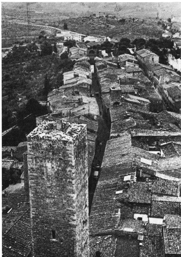
San Gimignano Italien. Turm der Familie Cugnanesi (Vordergrund) an der Via San Giovanni. In Bildmitte steht der kleine, dreiseitig von Wohnhäusern umfaßte Turm der Familie Cantagalli.

Ereignisse fehlen chronikale und sonstige Notizen, welche die Türme als machtpolitische Faktoren erkennen lassen würden. Aus diesen Erwägungen heraus erscheint mir eine Gleichsetzung von «torri gentilizie» und den zürcherischen «Adelstürmen» als unzutreffend. Ebenso ist vom Gebrauch der aus dem Italienischen übernommenen und eingedeutschten Bezeichnung «Geschlechterturm», die in ihrer inneren Abhängigkeit zu sehr dem italienischen Beispiel verpflichtet ist, abzusehen.