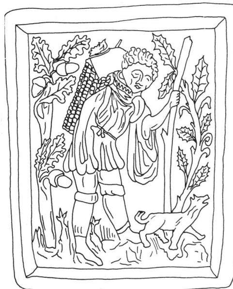
Bauer im Eichenwald. Gebogene Füllkachel, um 1460, 20,5 × 25 cm.

Die Herren von Wädenswil erscheinen 1130 erstmals in den schriftlichen Quellen. Zusammenhänge mit den Herren von Eschenbach scheinen möglich. Die Geschichte der Herrschaft Wädenswil ist interessant, denn eine erste Phase umfaßt die Zeit des Freiherrengeschlechts vor 1287. Nachfolger waren die Johanniter, welche Grundbesitz und Rechte des letzten Freiherrn käuflich erwarben. Das nicht geschlossene Gebiet bildete anfänglich keine selbständige Kommende, sondern es war dem Hause Bubikon unterstellt, erlangte aber um 1330 verwaltungsrechtliche Selbständigkeit. Von da an amtierten in Wädenswil eigene Komturen.