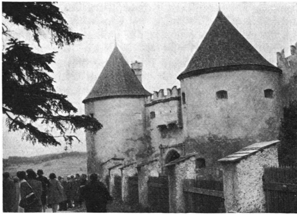
Rappottenstein, Niederösterreich. Das imposante äußere Burgtor. 6. Mai 1968.