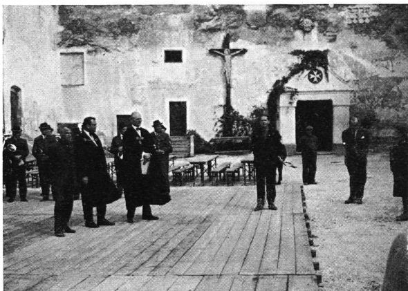
Mailberg, Niederösterreich, Empfang durch den Fürsten Großprior, seinen Kanzler und die Dorfmusik im Hof der Burganlage. Im Hintergrund der Eingang zur Kirche. 3. Mai 1968.

Nach der genußreichen Fahrt entweder mit dem «Transalpin» oder mit dem Flugzeug nach Wien und nach Bezug der einwandfreien und guter alter Hoteltradition entsprechender Unterkunft im «Hôtel de