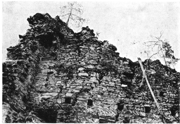
Ober-Tagstein GR Schildmauer. Durch jahrhundertelangen, intensiven Pflanzenwuchs ist das Mauerwerk an zahlreichen Stellen auseinandergesprengt worden. Der Einsturz wird nur noch eine Frage der Zeit sein.

Ahnengalerie und der stimmungsvolle Abend in der Schloßtaverne.