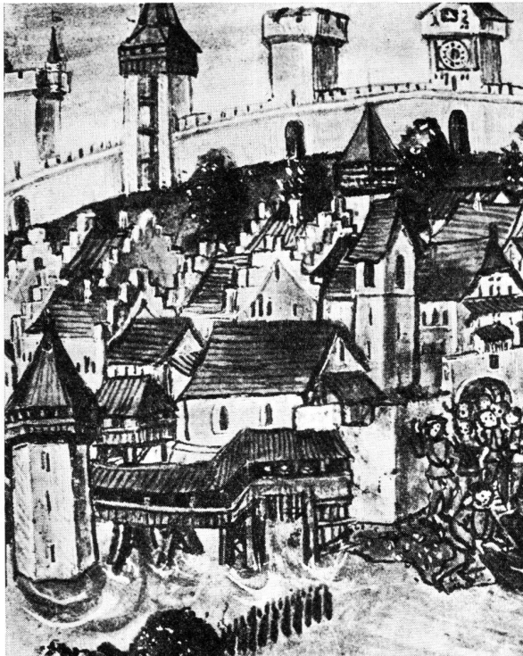
Luzern. Wasserturm, rechtsufrige Kapellbrücke und Wighaus. Im Hintergrund vier Türme der Museggmauer. Ausschnitt aus Tafel 84 von Diebold Schillings Luzerner Bilderchronik von 1513.

offtermalen by nacht ynfäl gethan, roub von vych und andern genommen und wider darvon gefaren.» (Renward Cysat, Collectanea, I. Teil, Luzern 1969, p. 242)