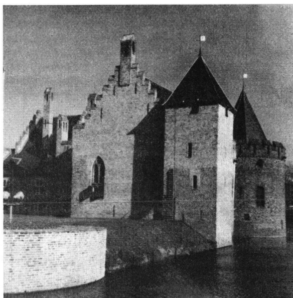
Medemblik Holland. Schloß im westlichen Friesland. Erbaut ab 1288. Bekannt durch die alljährlich im Sommer hier stattfindenden Freilichtaufführungen.