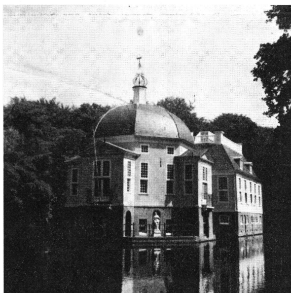
Trompenburg Holland. Wasserschloßchen im s'Graveland, nördlich von Hilversum. Erbaut im ausgehenden 17. Jahrhundert durch den holländischen Staat, als Geschenk für Cornelius Tromp, der sich als Seefahrer um die überseeischen niederländischen Gebiete besonders verdient machte.

Hotel «Alpha» im Süden der Stadt –, hatte seine Tore einen Monat vor unserem Einzug geöffnet. Mit seinen 600 Zimmern und 1200 Betten ist es zur Aufnahme größter Reisegesellschaften konzipiert. Es ist durchorganisiert und hat seinen eigenen, unveränderlichen