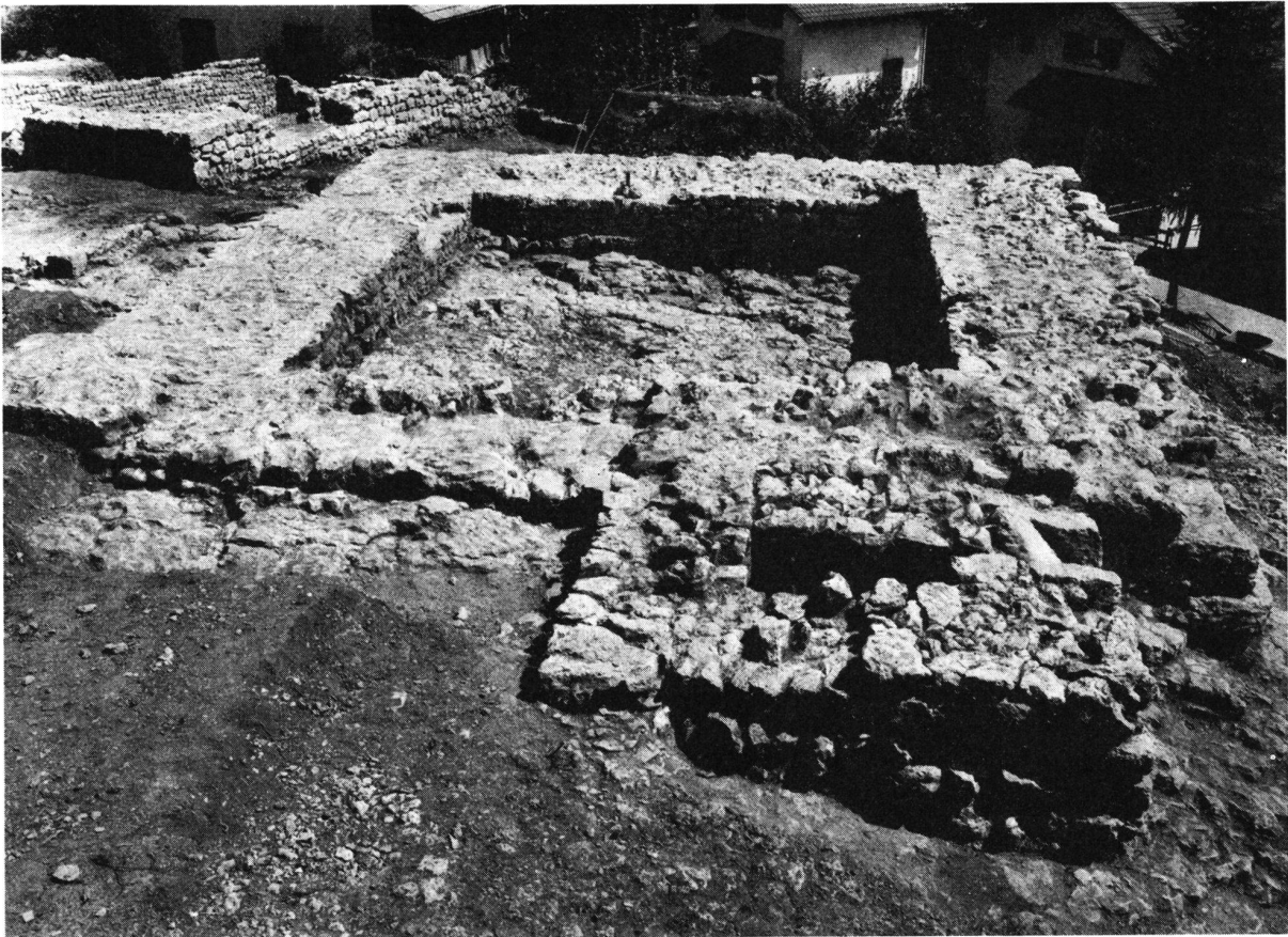
Rickenbach SO Burgstelle. Turm mit Abortanlage, im Hintergrund links der Pferdestall. Spätes 11. Jahrhundert. Ansicht von Nordwesten.