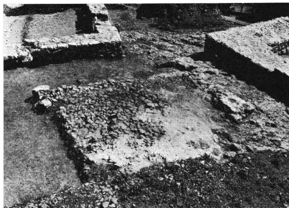
Rickenbach SO Burgstelle. Gehniveau des ersten Wohnbaues. Ansicht von Norden.

Das Mauerwerk der Burganlage fällt durch seine Qualität auf: die Ringmauer besteht im Ostteil aus kleinen, quaderförmigen Bruchsteinen, der Turm und der Nordost-Trakt bestehen aus größeren, ebenfalls sorgfältig zurechtgehauenen Steinen.