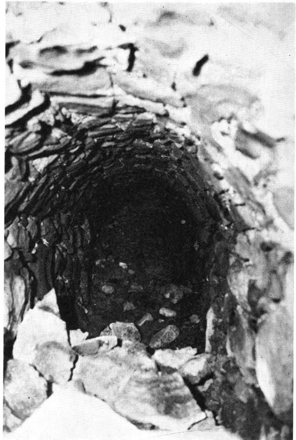
Rapperswil SG Unterirdischer Gang. Teilstück in der Nähe des Rathauses. Aufnahme vom 12. Oktober 1938.

Der Gang leitet mit geringer Steigung gegen die Burghalde hin; mit zwei vertikalen Eisentreppen sind ungefähr in der Mitte und unmittelbar vor dem oberen Ausstieg zwei Geländestufen zu überwinden. – Die beiden Ein- bzw. Ausgänge sind leider mit Ze-